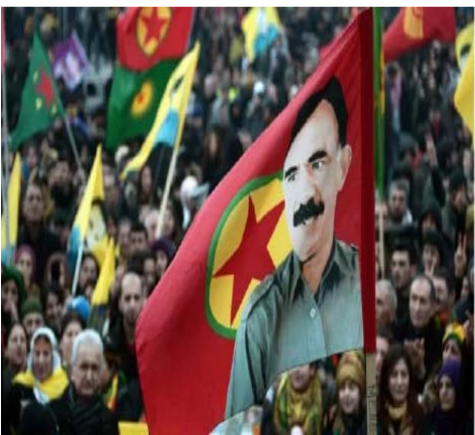
أوجلان مع أعضاء الحزب في كردستان.