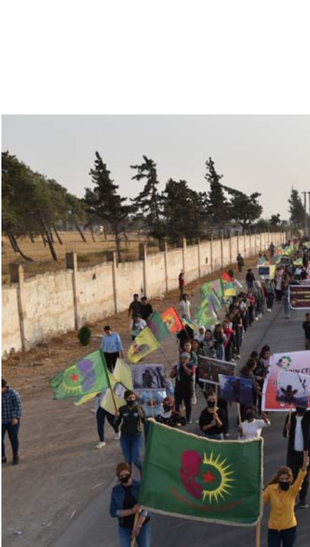
أهالي كوباني يرفعون أعلامهم في ساحة الشهداء

تروج حكومة دمشق بشكل مستمر لأخبار عودة أعداد كبيرة من النازحين إلى المخيم،