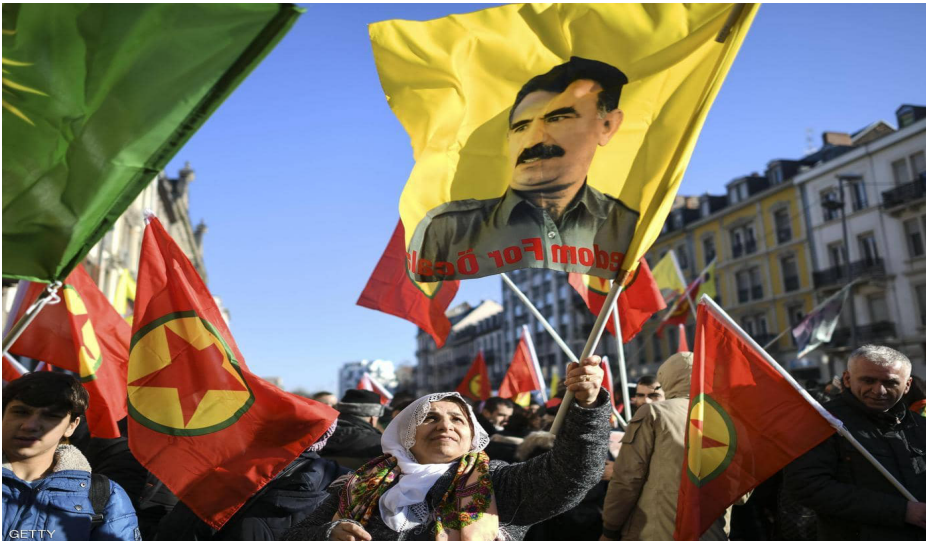
مركز الأخبار - أحد عضو لجنة حرية القائد عبدالله أوجلان.