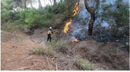
حرائق حراجية في عفرين