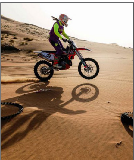
ملحوظ في الإمارات. وكالات

مجموعات، لدينا مجموعات مختلطة، الرجال على النساء. نخرج كل يوم سبت أو أحد. الآلية هنا متقنة للغاية، لذلك نحن مخطوطين بوجود مساحات واسعة من الصحراء للانطلاق فيها.» وتأسست المجموعة التي تضم أكثر من ٢٠ امرأة من الهوايات، وشبه المحترفات في عام ٢٠١٨، وأتاحت الفرصة أمام أكثر من ٢٠٠ سيدة لتجربة تلك الرياضة منذ عام ٢٠١٩. ورغم الحرارة التي تصل إلى ٤٠ درجة مئوية في غالبية أيام السنة، والرطوبة العالية جداً في الدولة الخليجية الصحراوية، تزداد شعبية رياضة ركوب الدراجات الهوائية بشكل