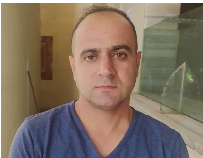
تحت شعار «سنحني وطننا وثورتنا»، يومي ١٥-١٦ من شهر تموز الجاري، وضمت منافسات ألعاب القوى؛ الجري ورمي الكرة الحديدية والوثب الطويل بالإضافة إلى بطولة القوة البدنية وشارك الأرقام التي تم تحطيمها التي وصلت إلى ٢٩٠ كغ، بينما سجلت الأرقام في السابق إلى نحو ٢٢٠ كغ، حيث لأول مرة يتم كسر فيها هذه الأرقام على مستوى شمال وشرق سوريا، ممحاً إلى أن مثل هذه البطولات تعتبر ضرورية لأنها تزيد من خبرة اللاعبين المشاركين الأمر الذي يعكس على النشئة الشريفة وتخلق احتكاكاً جيداً من المؤكد أنه سيثمر في البطولات القادمة.