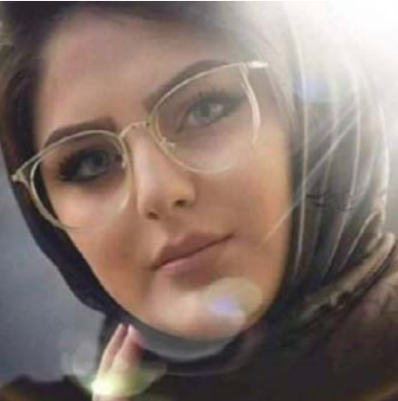
ريمآ آل كلزلي (أديبة سورية)

في مقالٍ سابقٍ حول قصيدة النثر، بغض النظر عن الخلاف على سُمِّي قصيدة النثر، تكلمنا على إرساء ملامحها كنوعٍ فني، تبلور بقطعةٍ شعريةٍ، تُعنى بوصفِ حالةٍ شُعريةٍ، من خلال صورٍ جماليةٍ يُستَطرَق فيها التكثيفُ، والإنزياحاتُ ضمن إيقاعٍ داخلي، دون أن نلتزمَ بنظمِ العروضِ، وبنمّا ملامحٍ بدائياتها، كما طالبنا بتأطيرها لحفظ تاريخ نشأتها، أما الآن فتحن نواكب الأفكارَ، التي تدعو إلى تطويرها، من خلال دعوةٍ مطروحةٍ، من قصيدة النثر إلى سُمِّي قصيدة المعنى.