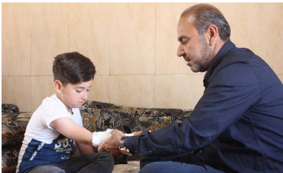
مهنة لم تندثر بعد

ويضيف الكردي الذي يحافظ على مهنة فتيات، ذكر لصحيفتنا «روناهي»، إنه ورث مهنة «المجبر» من والده الذي بدوره ورث المهنة من جده، التي عملت بها العائلة كمهنة إنسانية طوال المئة عاماً الماضية. لتتقهم بقدرتنا على علاجها».