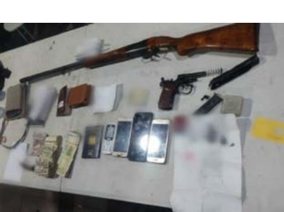
قيادي في مرتزقة داعش في ريف الرقة

وجاءت أحداث ذلك في بيان أصدرته قوات سوريا الديمقراطية قالت فيه: «تمت العملية بدعم ومراقبة جوية من قوات التحالف الدولي لمحاربة داعش».