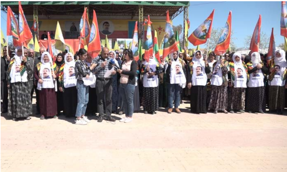
عوائل الشهداء في مدينة قامشلو، ١٤ نيسان 2022

الوطنية لتحقيق الأهداف التي استشهد من أجلها بناتهم وبنائهم.