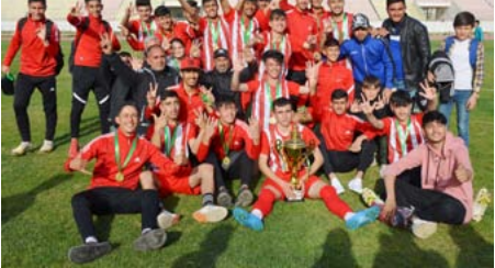
إقليم الجزيرة على صعيد الأشبال، عكر صفو البطولة، ما أفضدها رونقها ونجاحها.

روناهي/ قامشو . اختُتِمت منافسات بطولتي الأشبال والناشئين في شمال وشرق سوريا لكرة القدم في مدينة قامشلو. والتي شهدت تنويع إقليمي الفرات والجزيرة باللعب على حساب دير الزور والرققة.