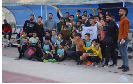
البطولة، ما أفضدها رونقها ونجاحها.

وكانت منافسات أول بطولتين للأشبال والناشئين في شمال وشرق سوريا لكرة القدم انطلقت في منتصف شهر آذار الماضي في مدينتي منبج والرققة، وأقيمت على أرضية المدينتين منافسات الدور الأول، بينما أقيمت منافسات الدور نصف النهائي في مدينة الرقة والمباريات النهائية في مدينة قامشلو.