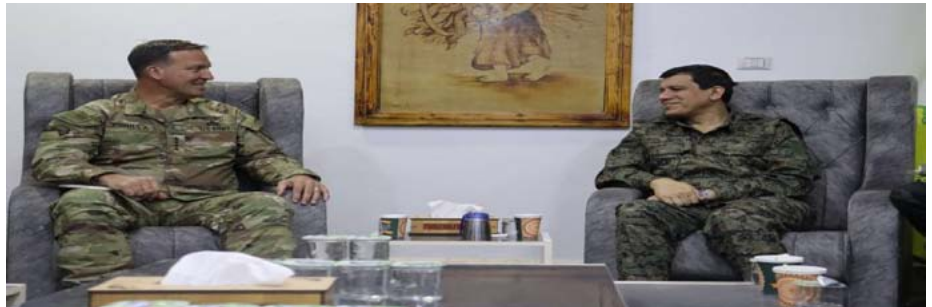
جنرال الجيش الأمريكي مايكل كوربلا في مكتبه مع قائد العمليات السورية الديمقراطية مظلوم عبدي.

ونشرت قوات سوريا الديمقراطية على موقعها الرسمي: «تم التباحث خلال اجتماع يهدف بين الطرفين حول خطورة داعش وعودة نشاطها الإرهابي في المنطقة».