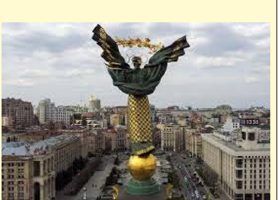
مركز الأخبار - وكالات

أكثر انسجاماً مع حيد اوكرانيا والتخلي عن الانضمام إلى الناتو.