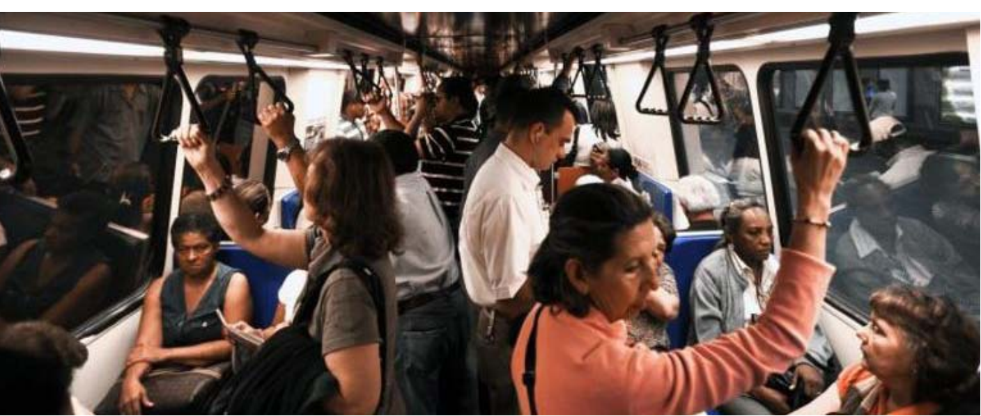
فسامحني، أحيانا قد نصادف لصوصا أشرف فبكثر من أولئك، الذين يرفعون شعارات في مزيفة!

الجوع، واحتمل ذنبك ونذيبها؟ ... تحياتي لك». أنا صاحبك الذي انتشلك في الحافلة،