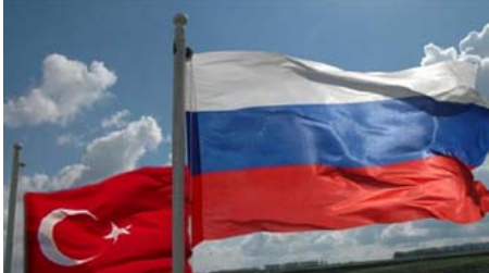
العلمين الأولى والثالثة. في هذه الفانين الروسية على أوكرانيا. فهذا الفانين الدولي الذي يعتمد على ازواجحة المعايير

بات وبالأ على الشعوب. الأمم المتحدة التي حكّمها خمس دول متناقضة في العالم. فعلى سبيل المثال كيف سينتجى مجلس الأمن قراراً ضدّ روسيا وروسيا؟ فتعلق حقّ الفيتو؟