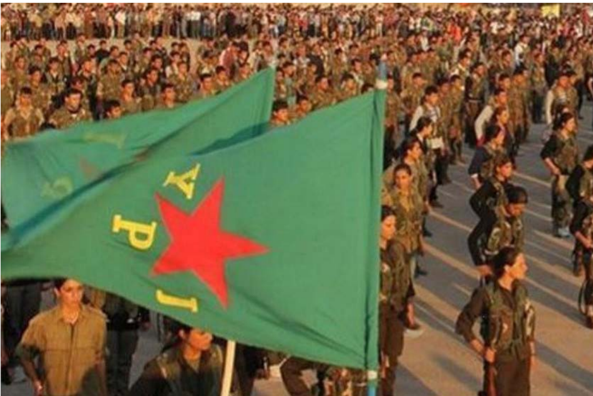
الاحتفال باليوم العالمي للمرأة في مدينة حلب، سوريا، 2022

ومن ناحية أخرى نحن ضد التجييش الذي هو من صنع السلطات، ومؤمنون بضرورة وجود قوات حماية جوهرية مجتمعية، لذا أحد مبادئنا في الحماية هو القوات المجتمعية وليس التجييش، فالجيش مجرد أداة بيد السلطات التي تحتكر أبناء ذاك الشعب لمحاربتهم به وخدمة الأنظمة وليس حماية المجتمع، لذا في شمال وشرق سوريا انتصار منظومتنا الدفاعية كان