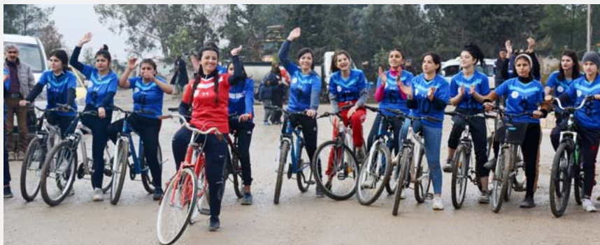
دون ملل يتدربن

قامشلو/ جوان محمد - في تحقيق كل إنجاز يعتبر للاعبات في مختلف الرياضات بإقليم الجزيرة عيداً جديداً، وسط تحديات كبيرة ومقاومة أكبر من المرأة الرياضية التي أوصلت صوتها للجميع بأنها قادرة على تحقيق الإنجازات على الدوام، وفي يوم المرأة العالمي نستطيع القول بأن يوم واحد لا يكفي بطلات إقليم الجزيرة لمختلف الألعاب لكي يحتفين بهذا العيد.