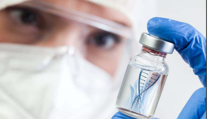
كيف يمكن أن ينتشر الفيروس الجديد؟

وتنصح بعض الأطباء بالقول من أنه قد يكون أيضاً أكثر عدوى، لكنهم يقولون إن هناك الكثير من الأشياء التي لا يعرفون عنها حتى الآن، بما في ذلك ما إذا كانت تتجنّب القاحات بشكلٍ أفضل أو تسبب مرضاً أكثر خطورة.