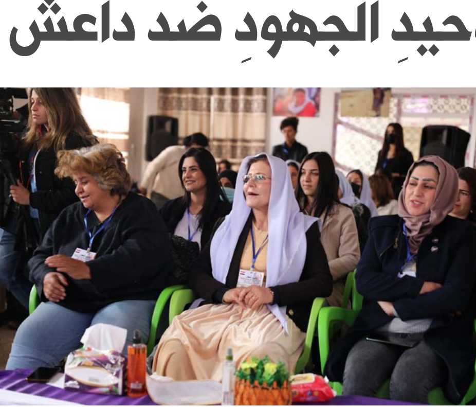
زهرة داعش في سجن الصنّاعة، ونحن النساء الإيزيديات، والعراقيات نبارك هذا الانتصار، الذي حققتّه قوات سوريا الديمقراطية، وبشكل خاص وحدات حماية المرأة YPJ».