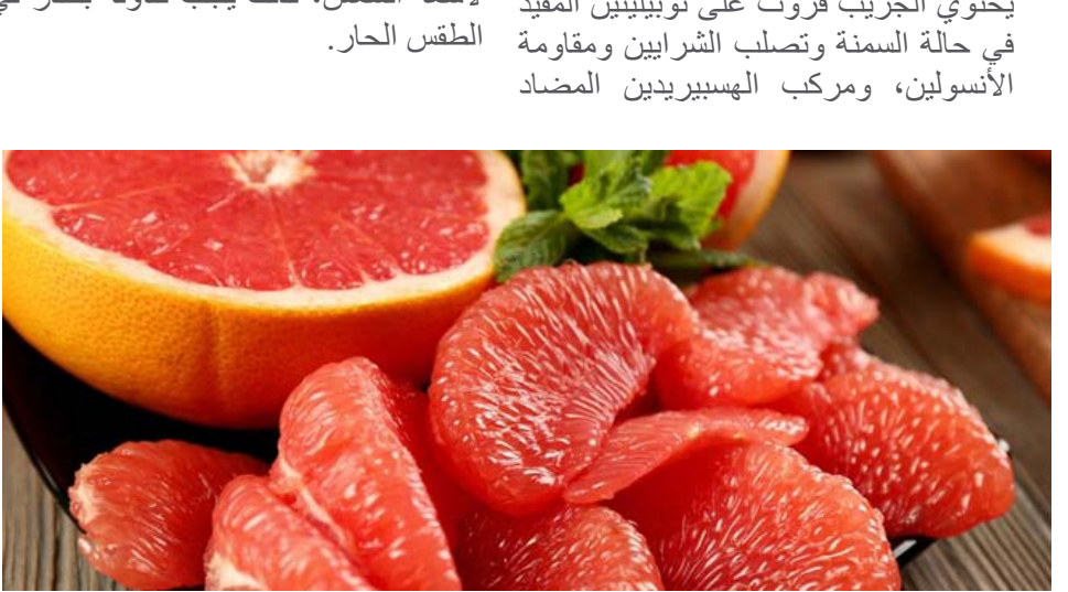
فوائد فاكهة الجريب فروت:

كما يزيد الجريب فروت حساسية الجلد لأشعة الشمس، لذلك يجب تناوله بحذر في الطقس الحار.