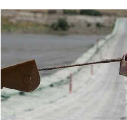
وأضاف نادر: إغلاق معبر سيملاكا الحدودي من جهة حزب الديمقراطي الكردستاني، عمل تخريبي ومسمي، وبات من المعلوم أنه

السياسة نفسها، ونتيجة ذلك دفع الشعب الكردي الثمن غالياً، وتعرض للولايات، الديمقراطي وقادته يلهثون وراء مصالحهم ويقانهم لأكثر مدة على سدة الحكم، والأهم استمرار حكم باشور ضمن العائلة، للتحكم بمفاصل باشور كردستان، ولو عمل القادة في باشور من أجل مصلحة الشعب الكردي، لاستفاد الكرد في الأجزاء الكردستانية الأخرى منها بشكل كبير.