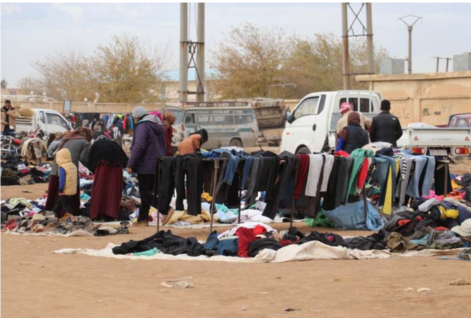
سوق الثلاثاء الشعبي في ناحية جل آغا، يتوافد إليه الناس من محيط الناحية وبلداتها وقراها وذلك بسبب بساطته وأسعاره المناسبة. فتكتظ ناحية جل آغا في كل يوم لثلاثاء بالناس والسيارات الوافدين إلى سوقها الشعبي منذ أكثر من 30 عاماً.

« كيلو بألف»... ريانة يا بندورة» «كل قطعة بخمسة آلاف يا بلاش». عبارات تعود على سماعها الناس القادمون للتبضع في سوق الثلاثاء في ناحية جل آغا، بمطبات منتشرة على مرآة العين بالقرب من دوار الترافيك في الناحية، منها لبيع الخضار والفاكهة، وأخرى لبيع الملابس وهناك من يعرض الأدوات المنزلية فتجد في هذا السوق مستلزمات كافة، الباعة في هذا السوق ليسوا فقط من سكان الناحية، بل منهم من يقدم من مناطق بعيدة مثل قاشلو، وترته سبيه لبيع وعرض بضائعهم ففرصة البيع هنا أكثر حظاً، وذلك بسبب عدد الزبائن الكبير.