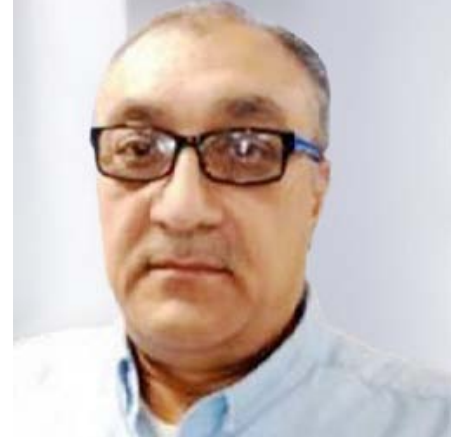
علي الصراف (كاتب عراقي)

ماذا سيكون شعور المرء لو أنه عاش في جوار مصيبة؟ كيف يتعامل معها؟ وفي تلح في حضرا، وفي الحالتين معا: إذا قويت، وإذا هُزمت؟ ولأنياب جاز جغرافيا وتاريخيا عنيد، فلا سبيل للنجاة من أضراره، إذا توصلت معها، أو قاطعتها.