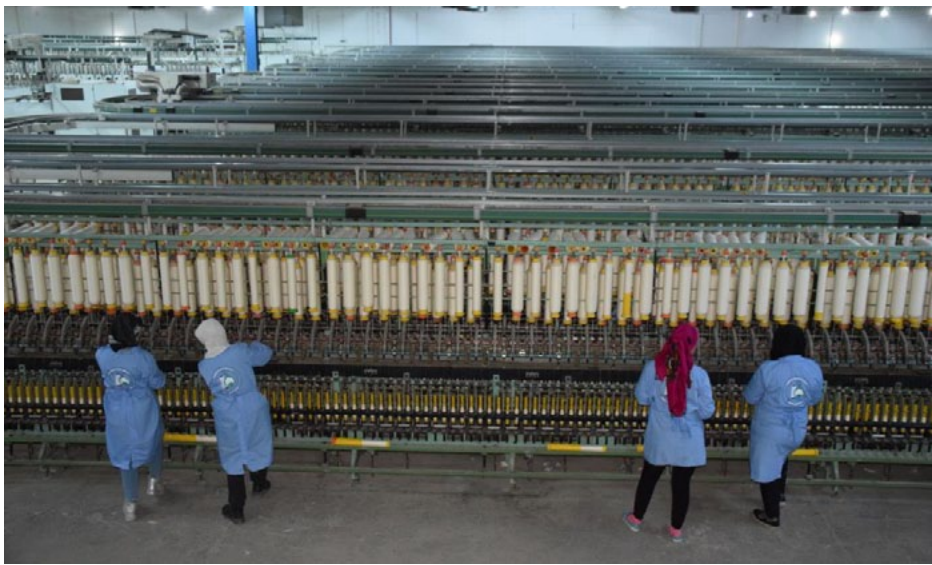
عمال في مصنع الغزل والنسيج في مدينة الحسكة، سوريا.