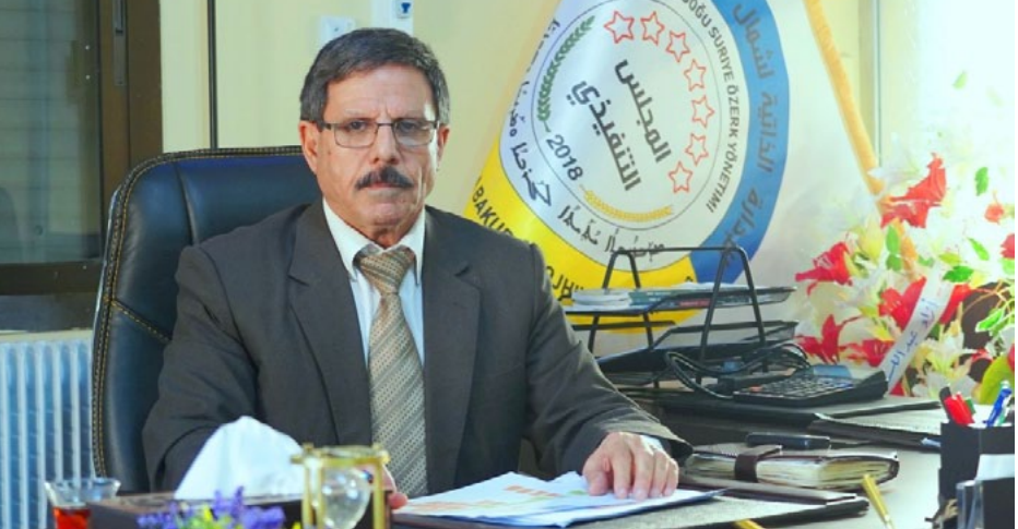
تكرر مشكلة العام الماضي..