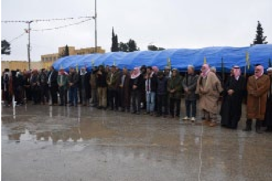
القائد الأمسي عبد الله أوجلان»، مشيرةً إلى أن

الهدف من العزلة على القائد هو خوف الدولة التركية من أفكار الحرية والديمقراطية. وحول ذلك اوضحت الادارية في اتحاد المرأة الشابة بمقاطعة كوباني نيروز بوزان لصحيفتنا قائلة: «نحن ندين ونستنكر بشدة العزلة المشددة على العزلة على القائد أوجلان، في محاولة لعزل