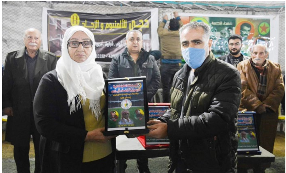
الشهيد أمضى حياته في سبيل خدمة قضية شعبه، وكان شخصية وطنية معروفة بكل أرجاء كردستان، وكسب ود واحترام الخصوم