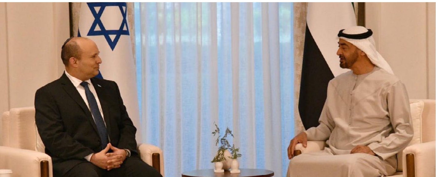
وزير الخارجية الإسرائيلي بني غانتز، في لقاء مع نائب وزير الخارجية الإماراتي، في مدينة دبي.

يأخذ المسارَ السياسيّ لدولة الإمارات وتيرةً متسارعةً ومدروسةً، في احتواءِ تداعياتِ الاستراتيجيةِ الأمريكيةِ الجديدةِ لشرقِ أوسطِ جديدِ عنوانها الأوّل، تكريسُ وجودِ إسرائيلِ دولةً طبيعيّةٍ بالمنطقةِ عبر اتّفاقٍ «إبراهيم» للسلام، والثّاني تَغييرِ سلوكِ الأنظمةِ المحوريّةِ مثل تركيا وإبغادها عن الإسلامِ السّياسي، ودولِ محورِ المقاومة، وبخاصّةِ سوريا وإبغادها عن إيران. وتوسعِ الإماراتِ لصيغةِ مصالحِةِ بين تركيا وسوريا والسعودية ودولِ خليجيّةِ أخرى، وتعزيزِ المحورِ السّنيّ «المتعدل» المرتبطِ أمريكيّاً واستيعابِ صعودِ طهرانِ بدعمِ بكين وموسكو.