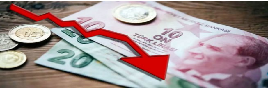
مركز الأخبار - تراجعت الليرة التركية إلى مستوي قياسي أمام الدولار. وأفادت وكالة «بلومبرغ»

2021/١2/13 ليصل سعر الدولار إلى ١٦,١6 ليرة تراجع 2٪ الاثني