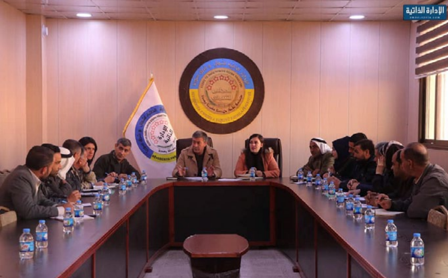
والأدوات الطبية وإيصالها لقاطني المخيمات في شمال وشرق سوريا.