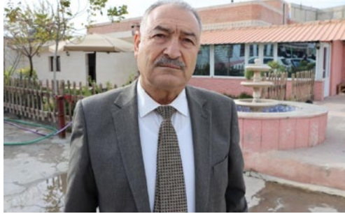
حجة عشيرة الفاضل بالشدادي مناف الرجا

وعن التسويات التي تجريها الحكومة السورية في درعا، ودير الزور، علّق الرجا عليها قائلا: «إن مناطق شمال وشرق سوريا، تختلف اختلافاً جذرياً عن درعا ودير الزور،