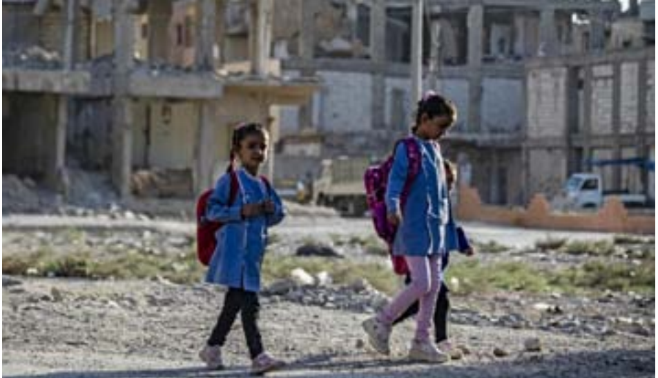
محررة الصفحة - ميديا غام