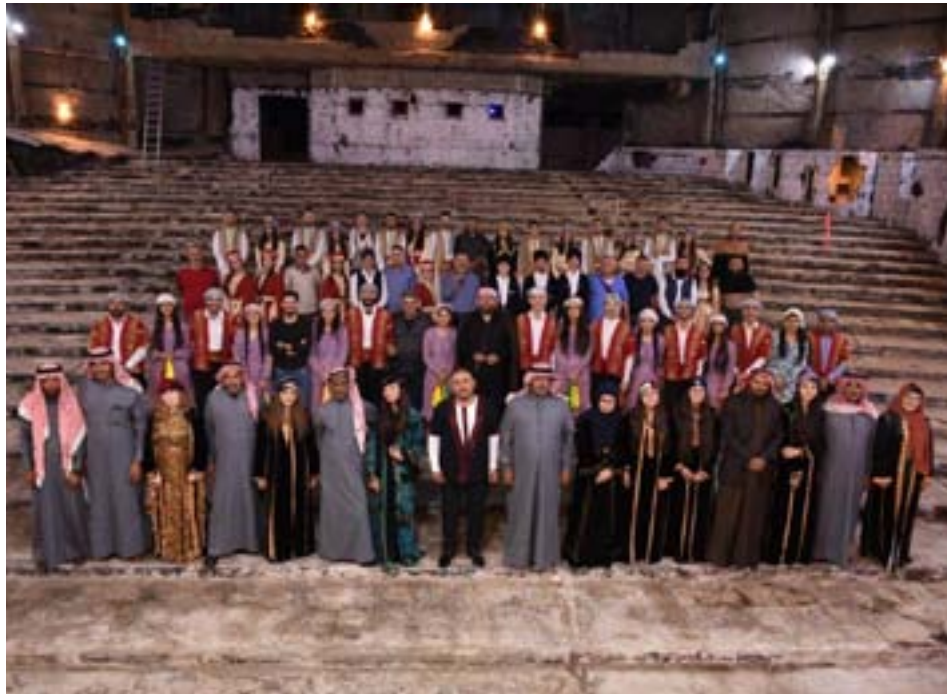
أغنية شعبية من مدينة حلب، سوريا، 2011.

الأغنية الشعبية التي تجمع شعوب المنطقة، وبعد أن تمت الموافقة عليها، بدأت هيئة الثقافة والفن في شمال وشرق سوريا بالتواصل مع الفرق الشعبية في المناطق كلها، حيث تمّ الاعتماد على مشاركة ستّ فرق شعبية، ويهدف هذا العمل إلى تأكيد وحدة المصير، والأخوة بين الشعوب جميعها، إضافة لدور هذا العمل الفني الكبير بإضفاء الطابع الشخصي الذي يميّز كلّ شعب من خلال العادات والتقاليد والزّي الشعبي والرقصات والديكيات المتنوعة، التي تنتمها هذه الفرق الشعبية لإحياء التراث الفلكلور الثقافي، الذي يجمع بين أصالة الشعوب، وتاريخ