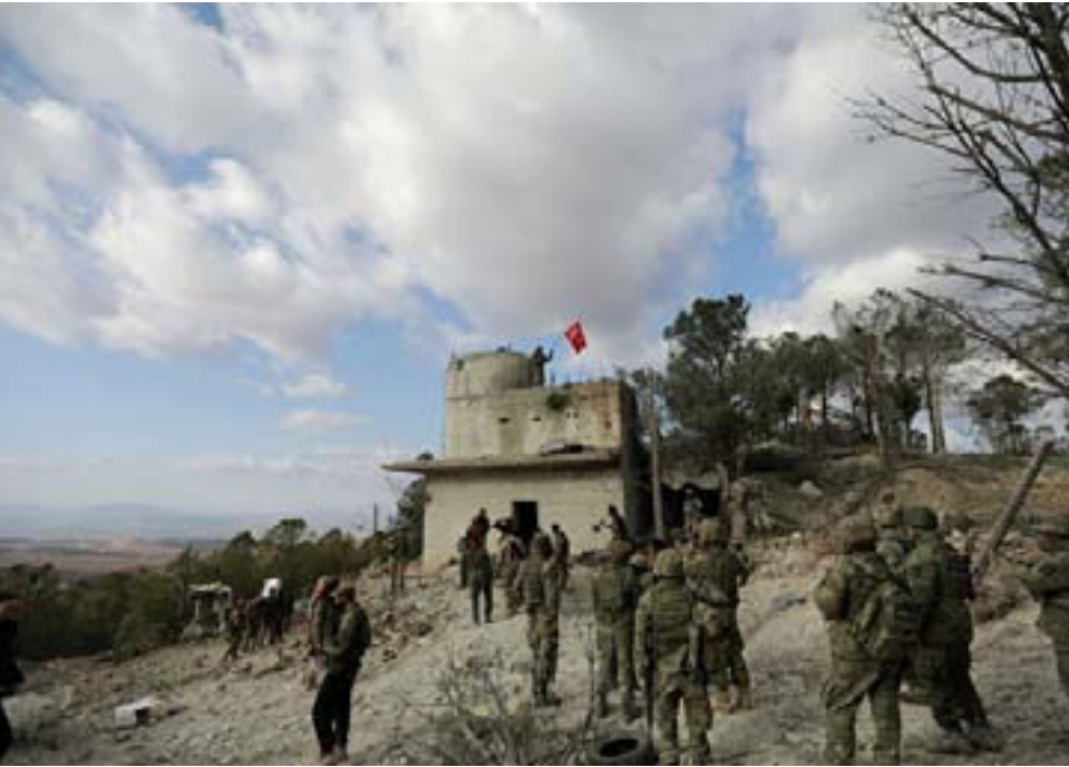
قوات سورية الديمقراطية

توجهات دمشق الماضية في خطة إعادة عقارب الزمن إلى ما قبل آذار ٢٠١١.