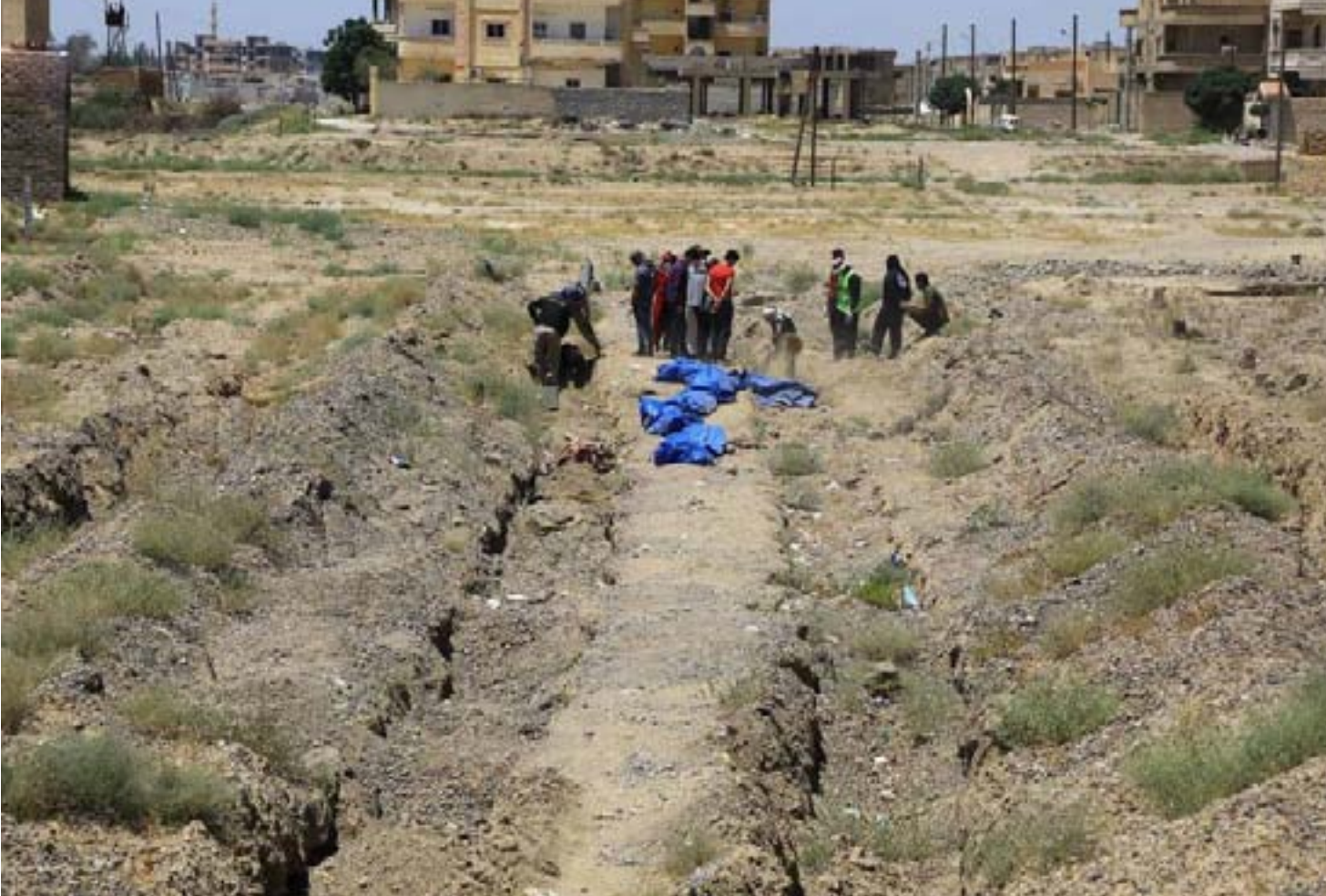
محررة الصفحة - ميديا غام