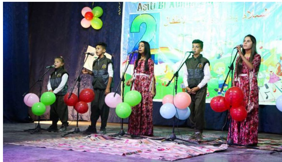
وتقاليد أمهاتهم وأجدادهم...»