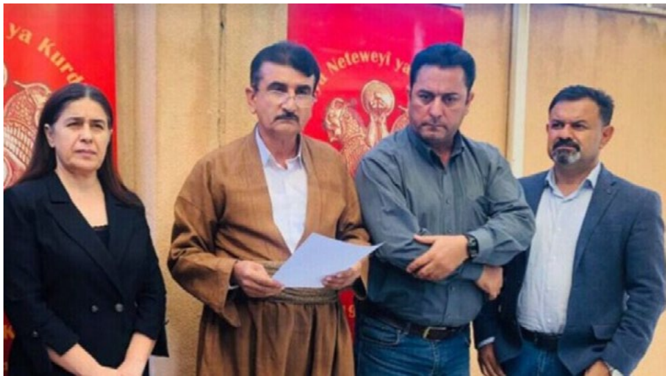
خطوات من أجل السلام، ندعو الحكومة العراقية وحكومة إقليم كردستان إلى عدم

المحتل التركي ينتهك حقوق الشعب الكردي وأوضح البيان: بأن الاحتلال التركي ينتهك حقوق شعبنا في باكور كردستان ويهاجم باثور وروج آفا كل يوم، هدف الاحتلال من هذه الهجمات تدمير منجزات شعبنا واحتلال جميع أراضي كردستان.»