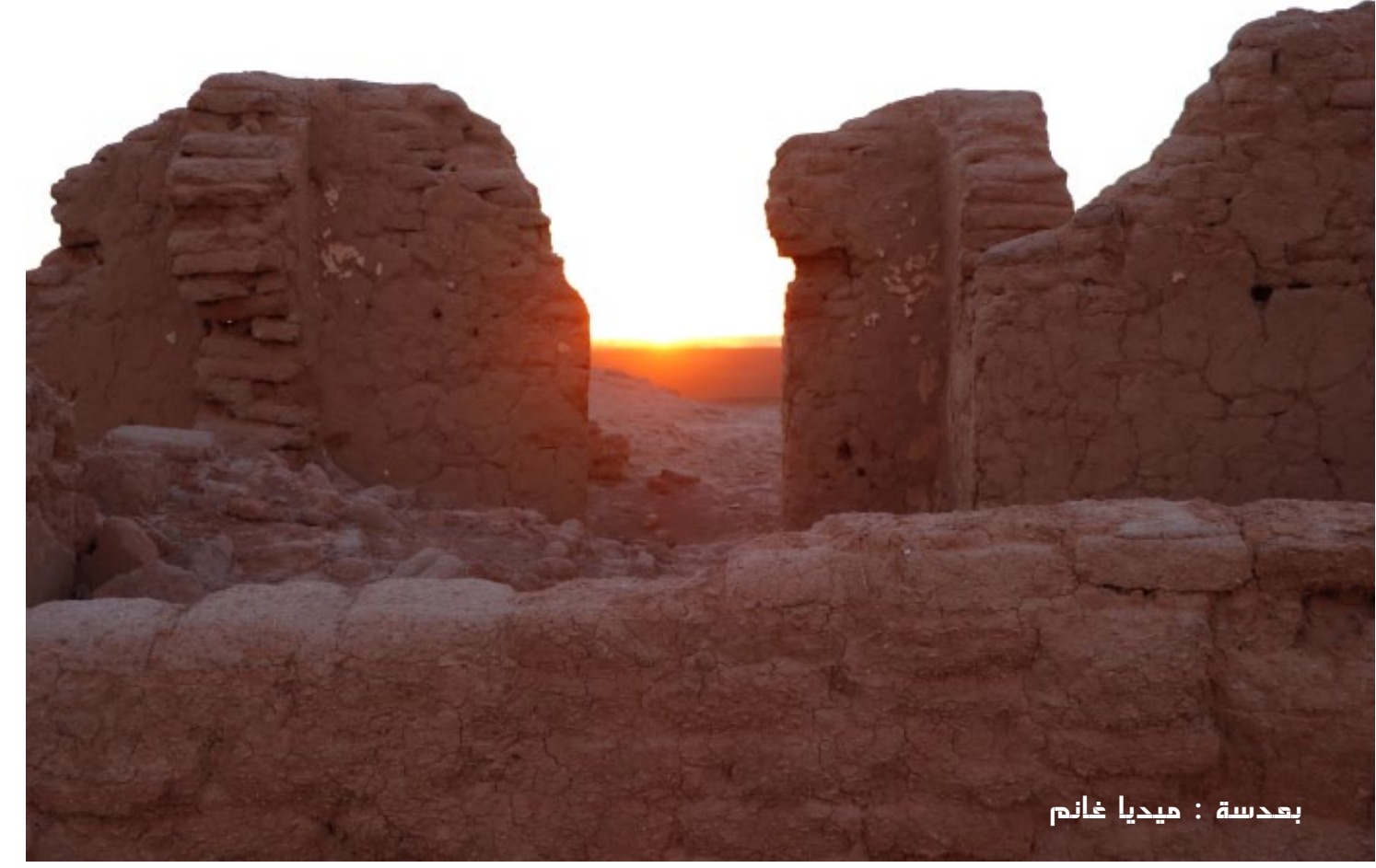
بعدة : ميديا غانم

أجرى باحثون دراسة جديدة على مجموعة كبيرة من الهواتف الذكية من كبار المصنعين، وأكدت أن جميع الهواتف الذكية العاملة بنظام "أندرويد" تقوم بإرسال كم كبير من البيانات إلى المصنعين ومطوري تطبيقات الطرف الثالث، المثبتة بشكل افتراضي على الهاتف، من دون علم المستخدم أو موافقته. كما أوضحت الدراسة أن تطبيق لوحة المفاتيح "SwiftKey" الخاص بمبايكروسوفت يقوم بجمع بيانات تصفيلية حول مدة استخدام "الكيبورد" على هواتف هواوي. وأوضح الباحثون، أن بعض المعلومات التي يتم جمعها من هواتف المستخدمين تظل مرتبطة بها، حتى وإن تم إجراء إعادة تهيئة لبعض الإعدادات، مثل المعلومات التوفيقية الخاصة بالإعلانات، فإذا قام المستخدم بإعادة تهيئة تلك المعلومات، فإن الأرقام التوفيقية الجديدة ترتبط من جديد بهاتف المستخدم. وسلطت الدراسة الضوء كذلك على أن