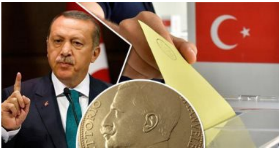
تصريحاته الأولية أن جميع الوثائق المسربة إلى الصحافة مزورة تستهدف الإساءة

أظهرت الوثائق السرية التي مرّبها لوسائل الإعلام مسؤول سابق في وقف توجفا نفسه أن الوقف من يقوم بتحديد الأسماء والوظائف العامة التي ستسند إليهم، بدلاً على الرغم من أن وقف “توجفا” زعم في