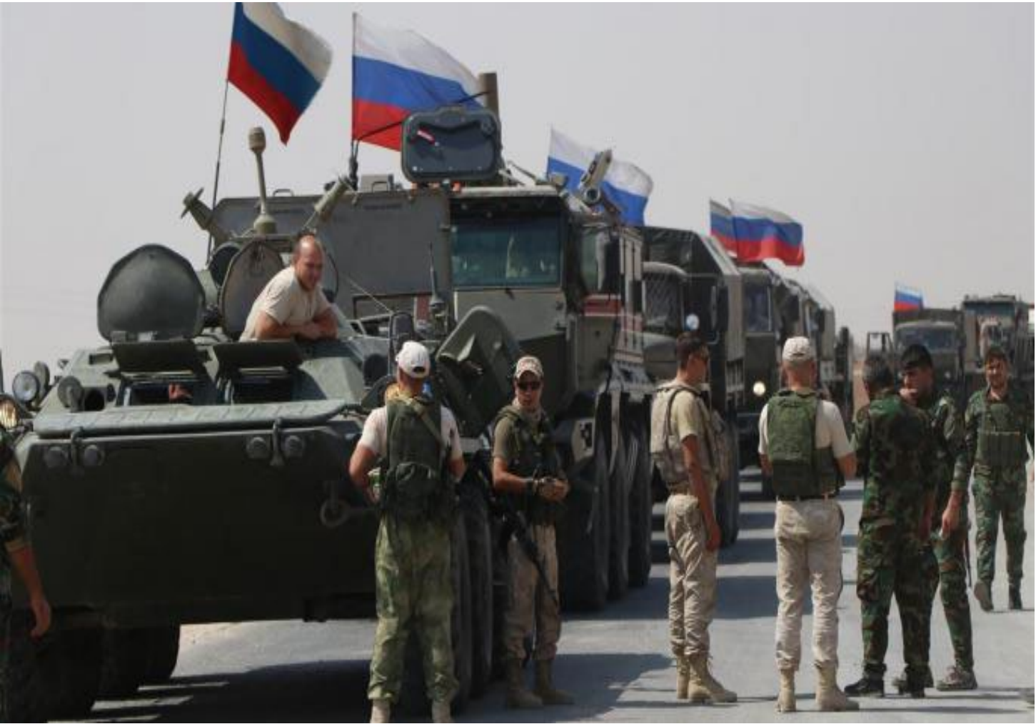
جنود روس يمشون في شوارع حلب، سوريا، مع دبابات روسية.

ست سنوات من العمليات السياسية الفاشلة والمحادثات بين الحكومة و(المعارضة)، منذ دخول روسيا إلى سوريا في عام ٢٠١٥ في سوريا لم تكن باهظة الثمن بالنسبة إلى الروس المجنود الروس وهم يقدمون الحروب وحيف و استأنا وغيرها عدم اهتمام الكرملين بفرض أي تنازلات حقيقية من طرف الأسد، حتى لو كان قادرا على تقديم تلك التنازلات.