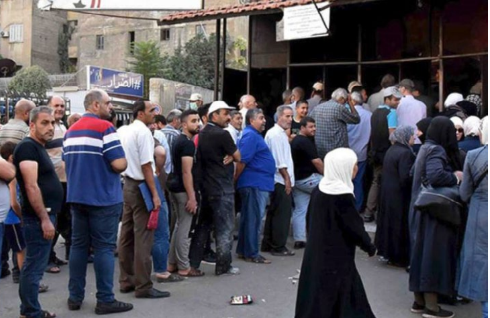
محررة الصفحة - عيبارحن محمد

النقص أثر بشكل كبير على وسائل النقل العام، التي يستخدمها على نطاق واسع من السوريين الفقراء والطبقة المتوسطة، ممن لا يستطيعون تحمل تكاليف السيارات الخاصة أو سيارات الأجرة.