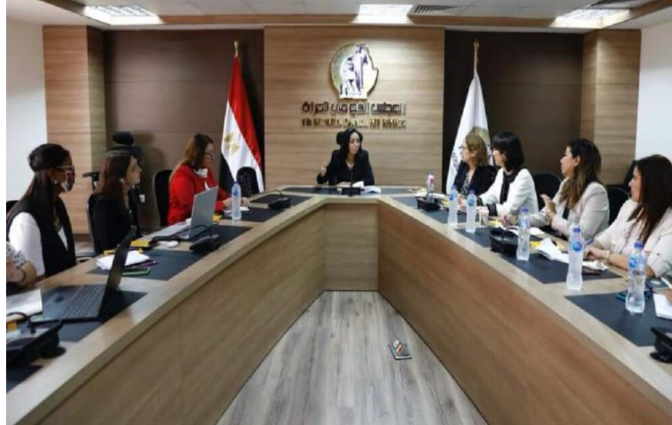
محررة الصفحة – ميديا غام

أكدت الدكتورة مايا مرسى رئيسة المجلس القومي للمرأة في مصر أنّ المرأة المصرية تخطو خطوات واثقة نحو الأمام في جميع المجالات، خلال استقبالها وفد مجموعة البنك الدولي.