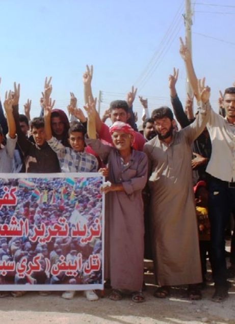
الاتفاق الدولية، وهذا هو السبب الرئيسي لوجوده في المنطقة لذلك هناك مسؤوليات تقع

تستمر الدولة التركية المحتلة ومرتزقتها بارتكاب انتهاكات بحق المدنيين في المناطق المحتلة، حيث أقدم مرتزقة ما يُعرف بصقور السنة الثاقبين للفرقة ٢٠ بتعذيب الشباب على السلطان النرج من عشيرة النعيم وإهائه بطريقة وحشية وغير أخلاقية، فيما تجددت جرائم الختلف مندميين من مناطق مقاطعة كري سبي المحتلة، وارتكاب مجازر بحق أهالي المنطقة كمجزرة (الصفاوية) التي راح ضحيتها عائلة كاملة في الرابع من شهر آب المنصرم.