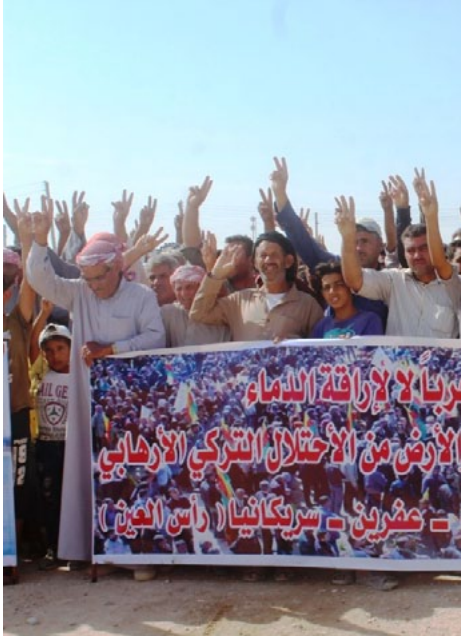
على عقاقهم في هذا الإطار وهي حماية المدنيين العزل في المنطقة، ووقف الاعتداءات التي