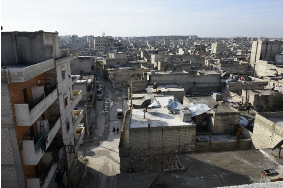
تخطيطات لقطاع الحصار في دمشق

مليون و٥٠٠ ألف ليرة سورية بينما تصل تكلفة ربلطة الخبز إلى ١٧٠٠ ليرة سوريةّ إلا أن الإدارة تبيعهما بسعر رمزي (٢٠٠) ليرة سورية.