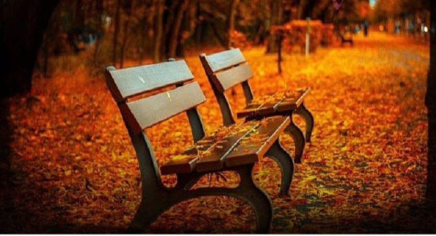
صديق جريفي يوبحي، وشهقة عتقي وهي

تتلقئ فوق ينباع القصاد، ترسم هدهدات القصيدة عبر منارة حنين الرّوح، فيزهو قلبك شوقاً إلى ضياء الحياة، باحثًا عن فرح فيما تبقى من أرخبيلات العمر، تهمسُ لقلبك المكتنز بوجه الاخضرار: إلى متى يحافظ المرء على نضارة الزمن العائص في مآهات لا تحطُر على بل؟! محبًا، كنت تعرف مثل طائر يموج جدلاً بين أشهى طلال الغابات، متابعًا ضواؤك، من أين لك كل هذه الطّاقات الفريحة، لترجمة كلّ هذا المهيمنة على أغلب محطات حياتنا في هذا الزمن العائص في مآهات لا تحطُر على بل؟!