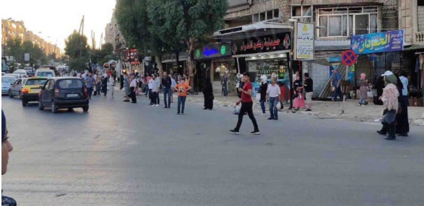
أشعر بالمرارة والألم».

وقبيل الحرب، كان والد «الحسين» يملك محلاً لبيع المعجنات في حي صلاح الدين، ويقول كافتيريا أو مطعم من هذه ٢٥ ألف ليرة على الأقل، ويضيف: «ذلك نصف راتبتي الحكومي الذي لم يخفّض بعد عتبة ٥٠ ألف ليرة بعد خدمة ١٢ عاماً».