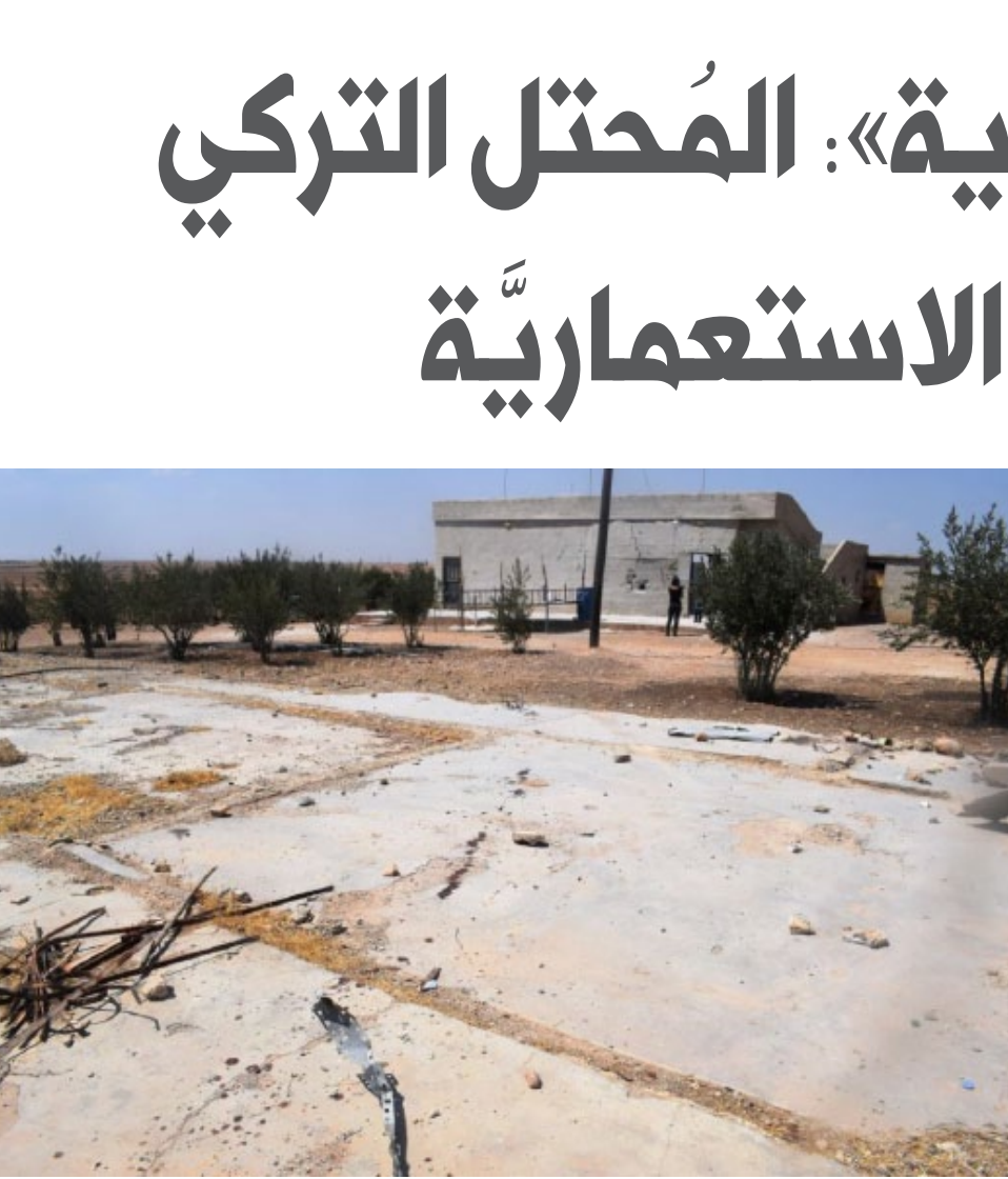
أشعر بالمرارة والألم».