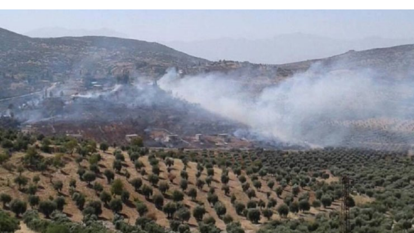
أصدقاء دائمين إنما مصالح دائمة».

ورغم فظاظة هذا الموقف أو العقولة ولكنه يكيننا نحن الشعوب التي تسعى إلى حل قضاياها إلى استخلاص الكثير من الاستنتاجات منها والعمل وفق ذلك، لأنه يظهر جلياً أن الاعتماد الكلي على القوى الخارجية ما هي إلا سداجة وغفلة قاتلة، وهذا ما شاهدناه مؤخراً في أفغانستان حيث الانهيار العنل، ليس للحكومة الأفغانية وجيشها المزعوم وحسب بل للمنظومة التي تدعى قيادة العالم!!..