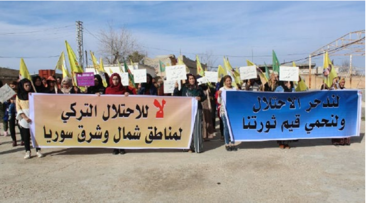
روكب تركيا من البارزانيين أن يعلنوا صراحة تخليهم عن القومية الكردية وعن الدفاع عن حيث أن كل الجرانم التي تركتبا هذه الدولة

الدولي حياّل هذه الجرانم التي تركتبتها دولة الاحتلال التركي، تؤكد بأن مصالحتها أكبر بكثير من حياة الشعوب وحقوقها المنصبة، حيث أن كل الجرانم التي تركتبا هذه الدولة هي جرانم تُركّب على مرأى ومسمع العالم أجمع، ولكن لا أحد يُبدي أي استنكار في هذا الخصوص وهذا يدل على التجارة التي تحاك بين هذه الدول على حساب دماء الشعوب التي تدفع قاتوره هذه الأعمال الإجرامية، ويبدو أن حلف الناتو واطني عما تقوم به تركيا من أعمال العثمانية البائدة والأراضي التي خسرتها إبان الحرب العالمية الأولى.