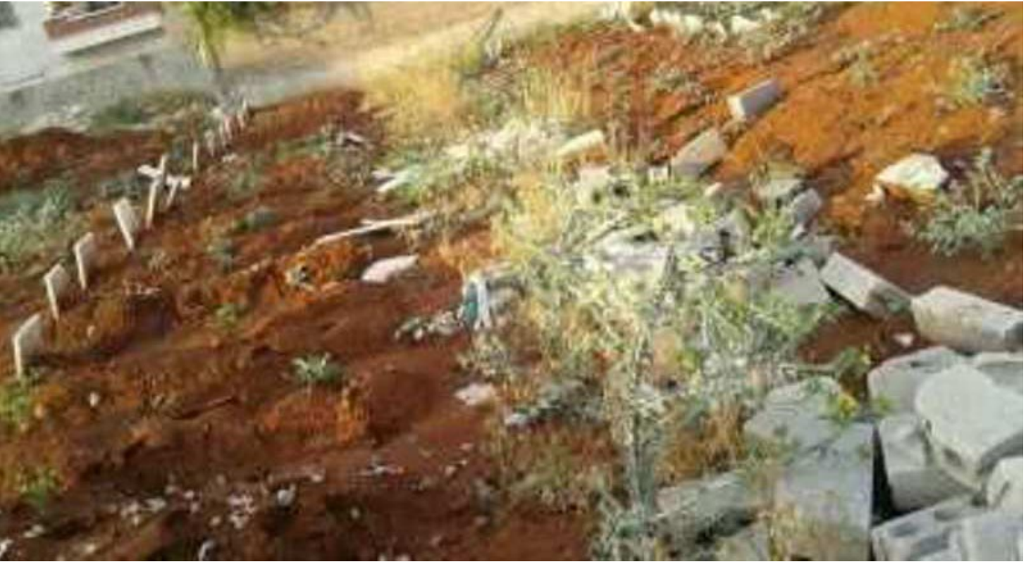
محررة الصفحة – ميديا غام

وتابعت: «آخر مرة تواصلت معه كان في ناحية بلبله، وأخبرني عن مدى هجبة ووحشية سيود في جنديرس، ومزار الشهيدة أفيستا على طريق كفر شيله في مركز المدينة، وفي سري كانيه هدمت المزار وبنّت معمل قطن،