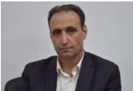
حوّل ثالث أستانا مسار اجتماعات أستانا