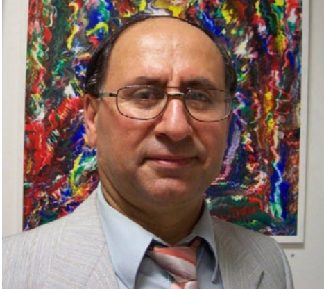
صبري يوسف (أديب وتشكيلي سوري)

أوَكِّدْ لَك يا عزيزتي الفاترة ويا عزيزي الفارئ، أنَّ المتحكك والمرح والفكاهة والكوميديا، كلُّ هذه الحالات تطيل العمر، وتُشفي الإنسان من الكثير من الأمراض، لهذا ترزوني أحقُّ في عالم خُلِقَ الفكاهة والنكتة والمرح والكوميديا،