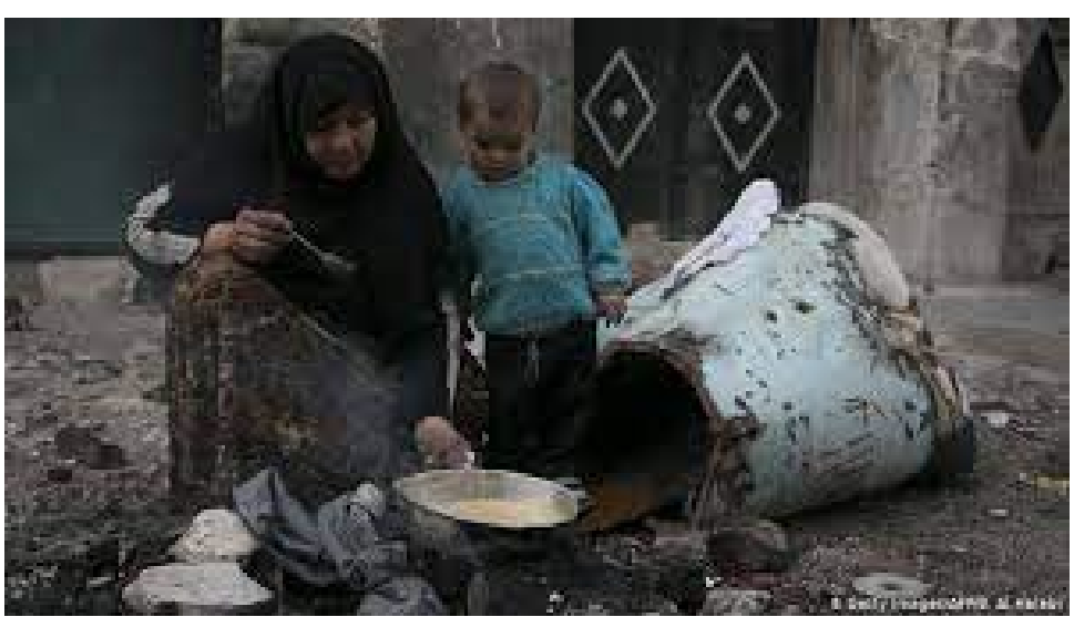
العالمي للبقاء على قيد الحياة.

وبلغت كمية المادة الموزعة عشرة أطنان من العلف الجاهز، تم توزيعها في كورمين قرية اليوسيفية، وذلك وفق ما نقله المكتب الإعلامي كبيراً ربما يتجاوز النصف خلال هذا العام من حيث العدد.