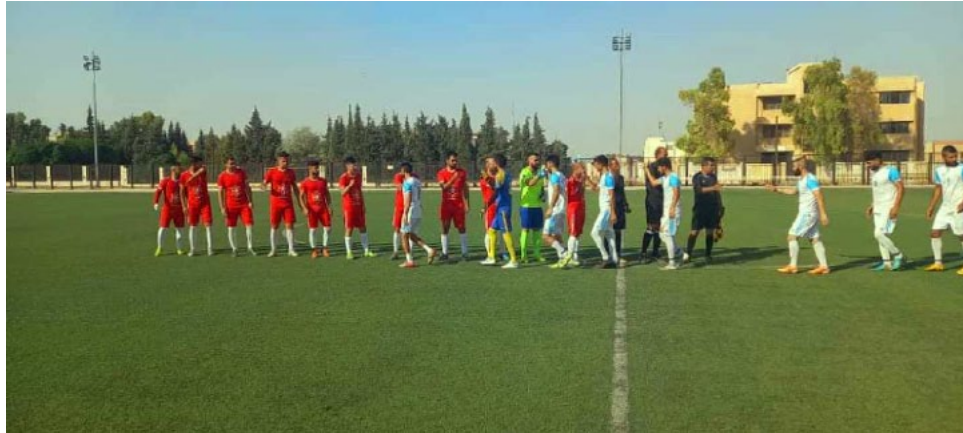
روناهي/ قامشلو - أقيمت منافسات الدور نصف