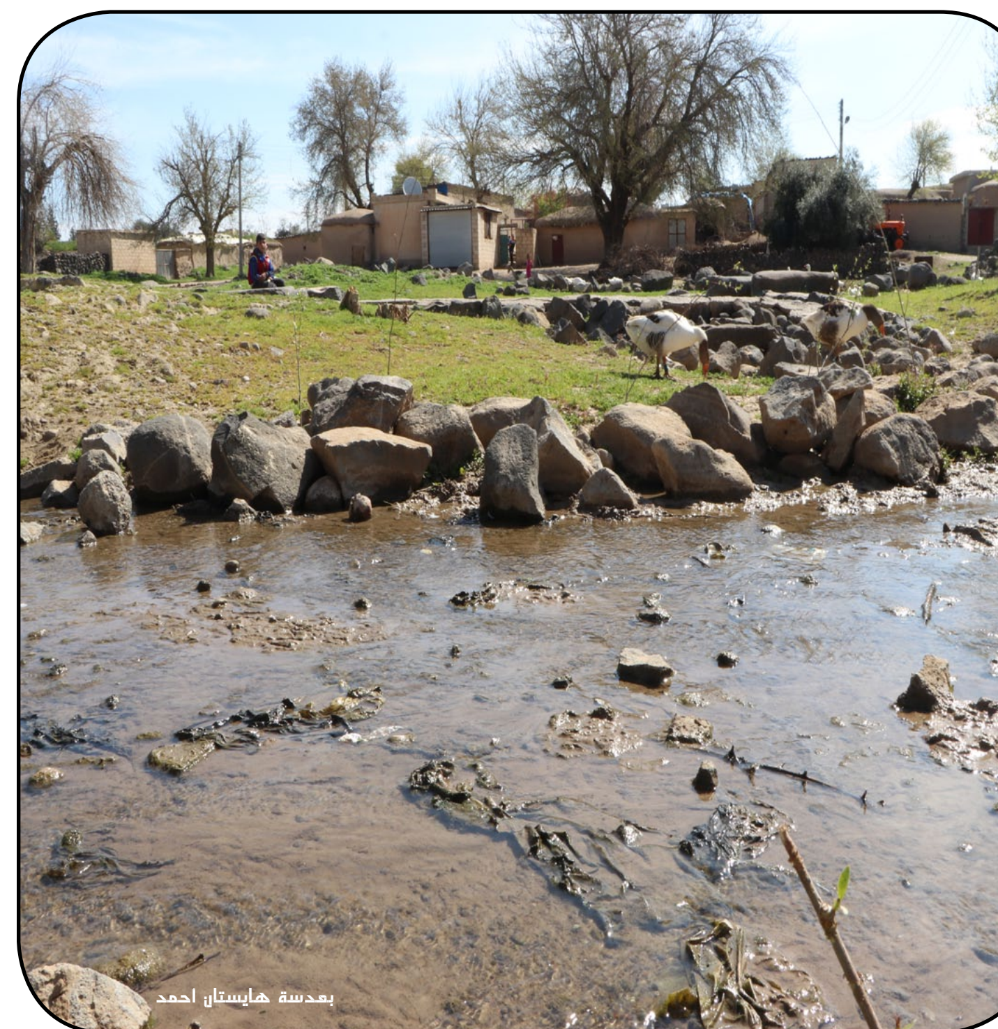
بعدها هاستان احمد

رئيسة التحرير: سوزان علي التدقيق اللغوي: ميسر الصلحان الطابع: ديلان احمد حسن مراد سياسة ثقافية عامة - تصدر عن مؤسسة روناهي للإعلام والنشر ٥٠ ل.س العدد ١١٢٥ - الخميس ٢٠٢١/٦/٣