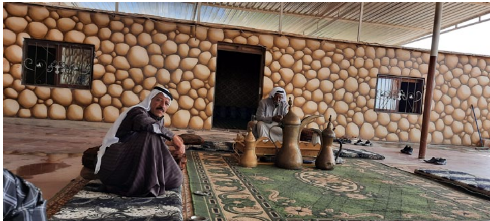
يسبحنه بالهاون النحاسي.

إكرامه. وأكد مكسب الصباح أنَّ الربعة مكان لحل القضايا والفصل والبث بها: «فكم من فتنة خمدت نيرانها بعد شربة فنجان قهوة، وكم من مشاورات وأعمال خيرية تلقفتها على راحة القهوة وشربها، فهي مكان للتكافل الاجتماعي، لها ميزانية مخصصة يشارك بها الجميع، وصندوق يخصص لمساعدة الأشد عوزاً وحاجة من أبناء القبيلة».