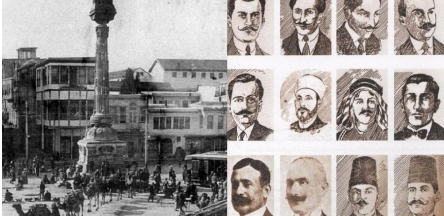
إعداد/ مريم الخوري

مجازر كبرى ارتكبتها جمال باشا السفاح وأنصاره ومرترزته في سوريا، كان أبرزها وأشهرها مجزرة أيار عندما أعدم خيرة شباب سوريا في دمشق وبيروت ظلماً منه أنه سيحكم سوريا إلى الأبد، فكان إعدام أولئك الأبطال شرارة ثورة اندلعت في بلاد العرب كلها، كادت أن تلغي وجود الأتراك من على وجه الأرض تماماً، فسقطت الأستانة وأزمير بيد أوروبا. وسقطت حمايتهم وقلاعهم في الشام كلها.. وزال حكم الظلم والطغيان واشترقت الشمس من جديد ليُتحقق قول الشاعر: