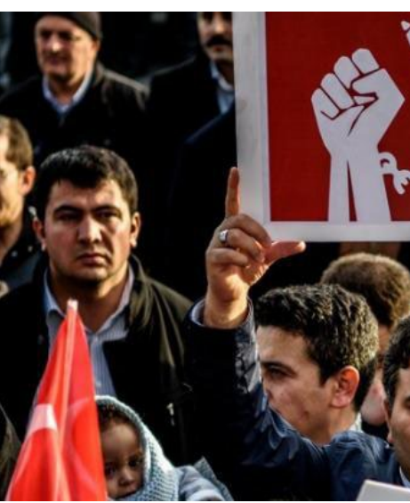
منصة الصحافة المستقلة (P٢٤).

وأضاف التقرير أن السبب في ذلك ليس Expression Interrupt التي تعمل ضمن