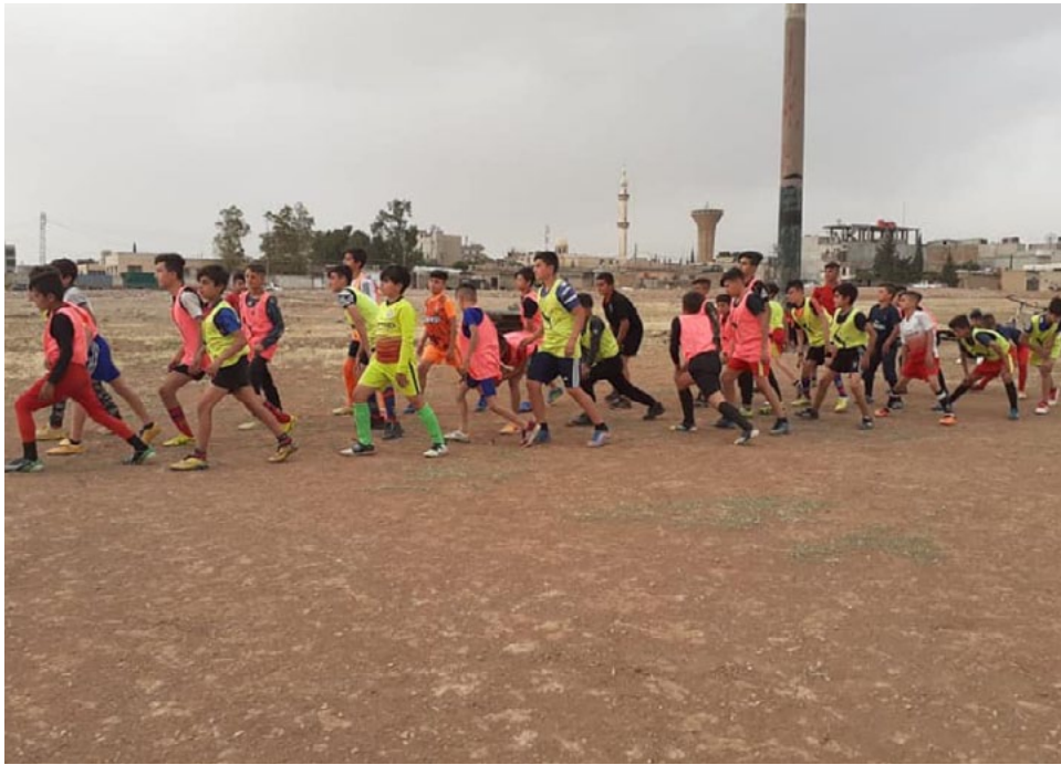
لاعبات كرة القدم في فريق نادي أربابها في مدينة قامشلو، إحدى أندية كرة القدم النسائية في المنطقة.

وتأتي المدارس الكروية بهدف تنمية وصلف المواهب للفتات العمرية من أعمار ست سنوات إلى ١٢ سنة، وفي هذا الوقت تعتبر هذه الأعمار