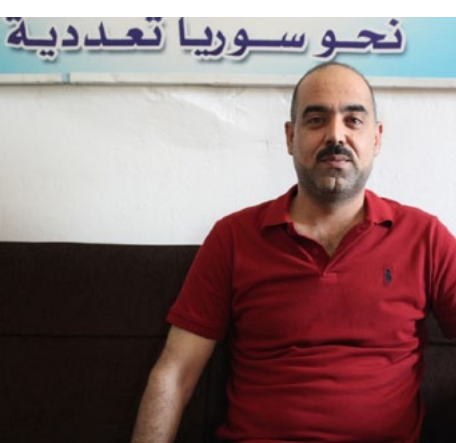
نحو سوريا تعددية

وأكد كدو: بالرغم أن الهدف من الحوارات توحيد الحركة السياسية الكردية في سوريا، إلا أنه تم تعطيل هذه الحوارات تحت حجج وذرائع مختلفة من قبل المجلس الوطني الكردي، فمثلاً يقولها: الحركة الكردية كانت دائماً وفيه ما يمتحجون بأن لديهم سبعة أو ثمانية أشخاص معتقلين، وأن القوى الأمنية في روج آفا تحقق مع بعض أعضاء المجلس في إحدى المناطق وتضيقهم، وقلنا لهم أن حزبنا اليساري من مؤسسي الإدارة الذاتية ومع ذلك يتم استجواب أعضائنا وسجنهم، وهي أمور طبيعية وليست