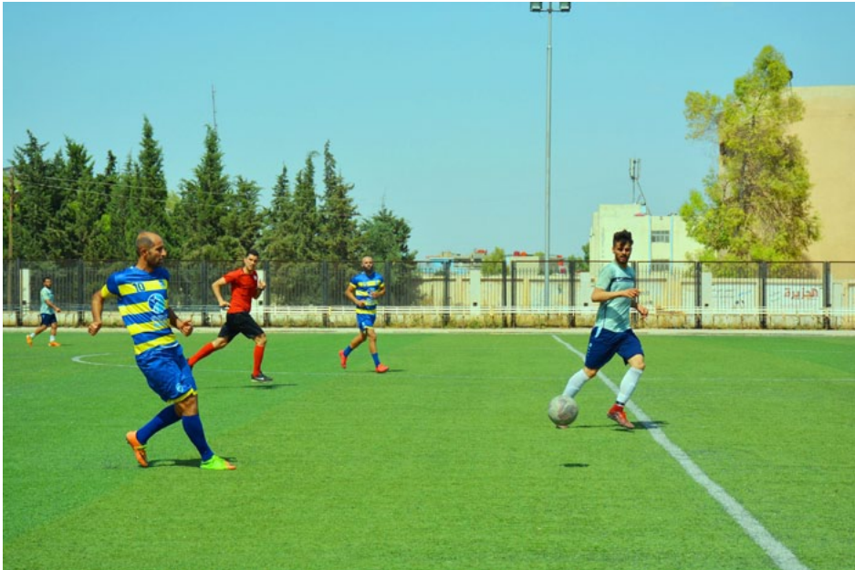
روناهي/ قامشلو - شهدت الجولة الخامسة ايأياً من دوري اتندية إقليم الجزيرة للرجال بكرة القدم نتائج كبيرة وابتات معالم الأندية المتأهلة والخاسرة تتوضح ونحن نقرب من نهاية مرحلة الإياب في الدوري.