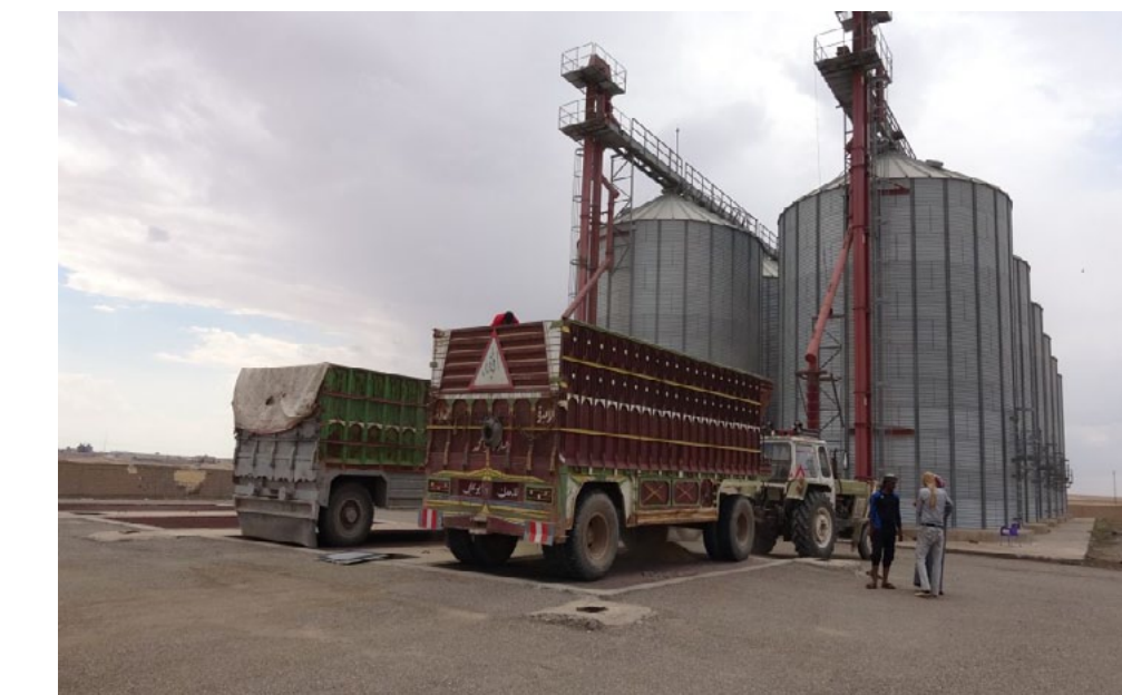
ويوجد بالذكر أن آلية تحديد تسعيرة الشراء

وكان الرئيس المشترك لهيئة الاقتصاد والزراعة «سلمان بارودو» قال في وقت سابق، إن الإدارة الذاتية ستعمل على شراء كامل محصول القمح في مناطق الإدارة الذاتية بشمال وشرق سوريا، في ظل ضعف متوقع في الإنتاج مقارنة بالسنوات السابقة.