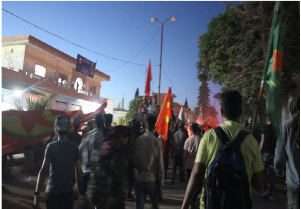
وأصدقائنا في متينا وزاب، الذين يسطرون

وتشير الشاب إلى أن هذه الأسعار هي ذاتها لم تتغير عن الأعوام الماضية، «لم ترتفع أسعار الصوف رغم الانهيار الكبير لليرة السورية أمام صرف الدولار، فالسعر الذي نبيع به هذا العام لا يتجاوز قيمته نصف أسعار الأعوام الماضية».