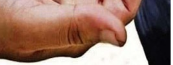
مقدرتهم على العمل في مهنة شريفة.

ومن الأسباب الهامة أيضاً غياب التكافل بين أبناء المجتمع، وقلة عدد مكاتب مكافحة التسول، إضافة إلى ضعف الرقابة الاجتماعية، فإذا فقد