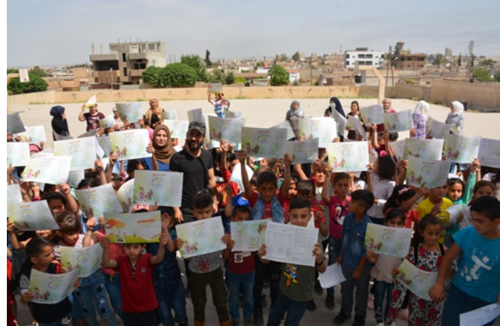
استلم طلاب مدارس قامشلو جلاءهم المدرسي بعد إنهاء عام دراسي تكلّل ببعض الصعوبات التي خلفها انتشار فيروس كورونا...٢