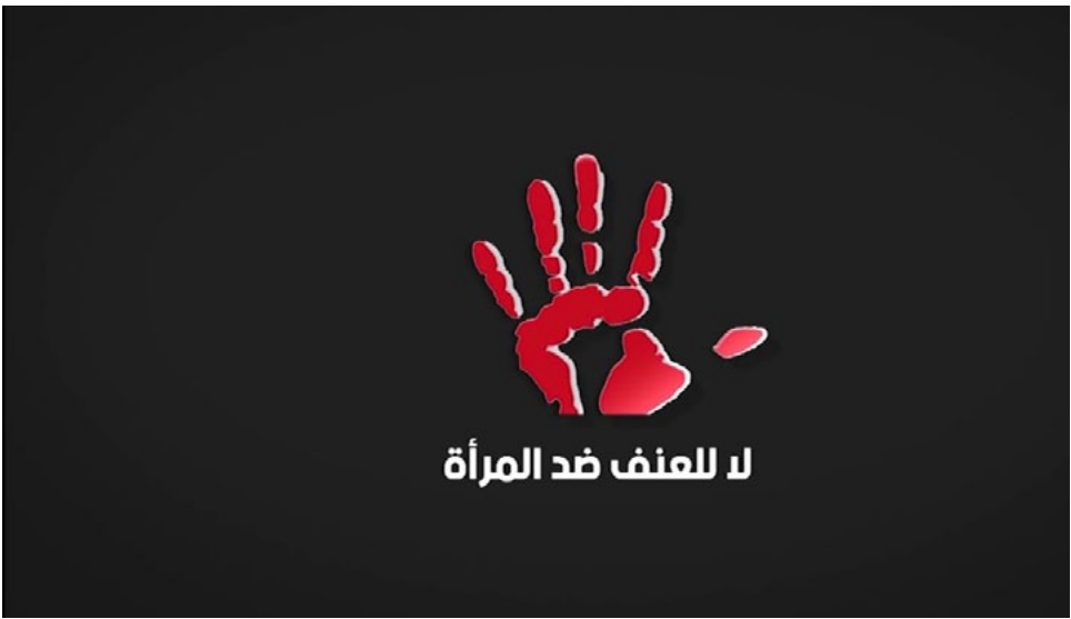
لا للعنف ضد المرأة

الاغتصاب هو من أكثر الجرائم المرتكبة ضد النساء حول العالم ولا زالت تتعرض لهذه الظاهرة وتتضاعف من قبل الذكور كونها خضعت للذهنية الذكورية منذ مئات السنين، وللد من هذه الظاهرة يجب أن تكون المرأة أكثر وعياً، والقوانين أكثر صرامة بحق كل مغتصب وجاني.