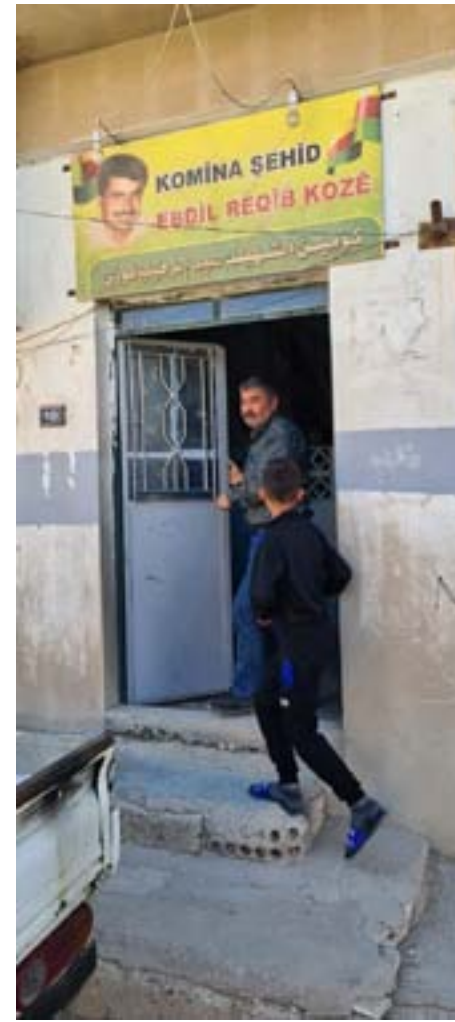
الهدف من المبادرة

قامشلو/رشا علي - نماذج مختلفة للأعمال الخيرية يصرّ بعض الأشخاص على القيام بها دون الإفصاح عن أنفسهم، وتصب هذه الأعمال في تعزيز التنمية المجتمعية والتكافل الاجتماعي، ومن إحدى هذه الأعمال تكفل أحد الأشخاص بتوزيع مادة الخبز على مئة عائلة طيلة شهر رمضان. يلعب العمل الخيري دوراً مهماً وإيجابياً في تطوير المجتمعات وتميئتها، وهو سلوك حي لا يمكنه النمو إلا في المجتمعات المتقدمة في الثقافة والوعي والمسؤولية، ويمثل قيمة إنسانية كبرى في البذل والعطاء بكل أشكاله، ويمكن لأي فرد الإسهام فيه حسب الإمكانيات والوسائل المتاحة من تطوع أو تبرع.