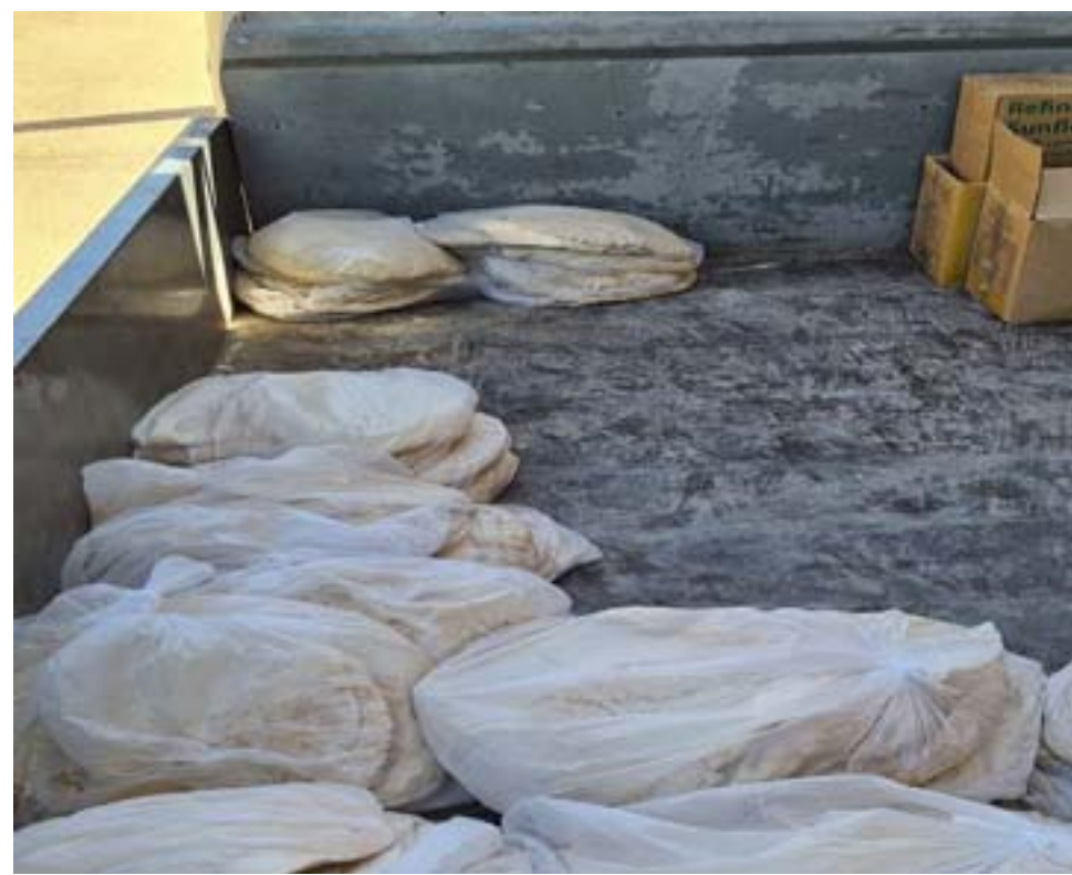
مئة عائلة استفادت من المبادرة

قامشلو/رشا علي - نماذج مختلفة للأعمال الخيرية يصرّ بعض الأشخاص على القيام بها دون الإفصاح عن أنفسهم، وتصب هذه الأعمال في تعزيز التنمية المجتمعية والتكافل الاجتماعي، ومن إحدى هذه الأعمال تكفل أحد الأشخاص بتوزيع مادة الخبز على مئة عائلة طيلة شهر رمضان. يلعب العمل الخيري دوراً مهماً وإيجابياً في تطوير المجتمعات وتميئتها، وهو سلوك حي لا يمكنه النمو إلا في المجتمعات المتقدمة في الثقافة والوعي والمسؤولية، ويمثل قيمة إنسانية كبرى في البذل والعطاء بكل أشكاله، ويمكن لأي فرد الإسهام فيه حسب الإمكانيات والوسائل المتاحة من تطوع أو تبرع.