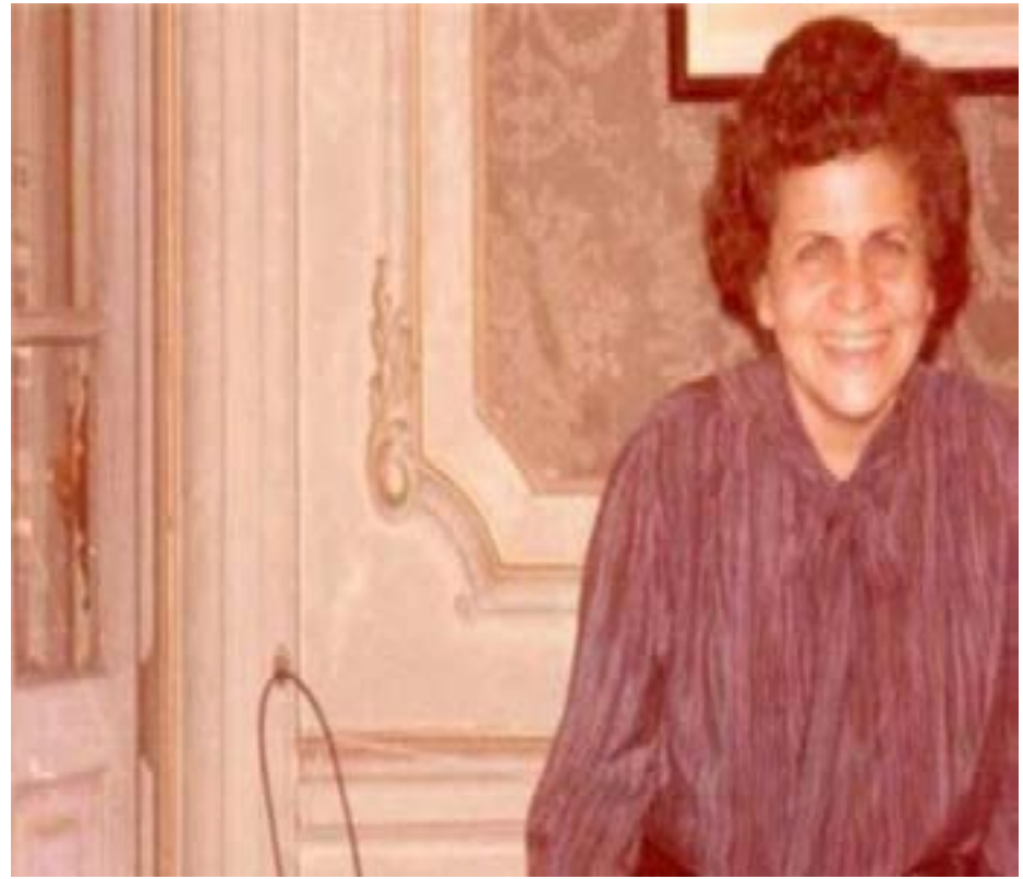
الهدف من المبادرة

توفيت أول مؤلفة موسيقية محترفة، وأحد أهم المرينين في مجال الموسيقى الأكاديمية في مصر والشرق الأوسط، الدكتورة عواطف عبد الكريم، يوم السبت ٢٤ نيسان الحالي، عن عمر ناهز ٩٠ عاماً. وكانت عواطف عبد الكريم، أول سيدة مصرية درست الموسيقى دراسة أكاديمية محترفة في «موتسارتيوم» وهي واحدة من أكبر المؤسسات التعليمية في العالم، وشاركت في إنشاء قسم التأليف والنظريات بالمعهد العالي للموسيقى التابع لأكاديمية