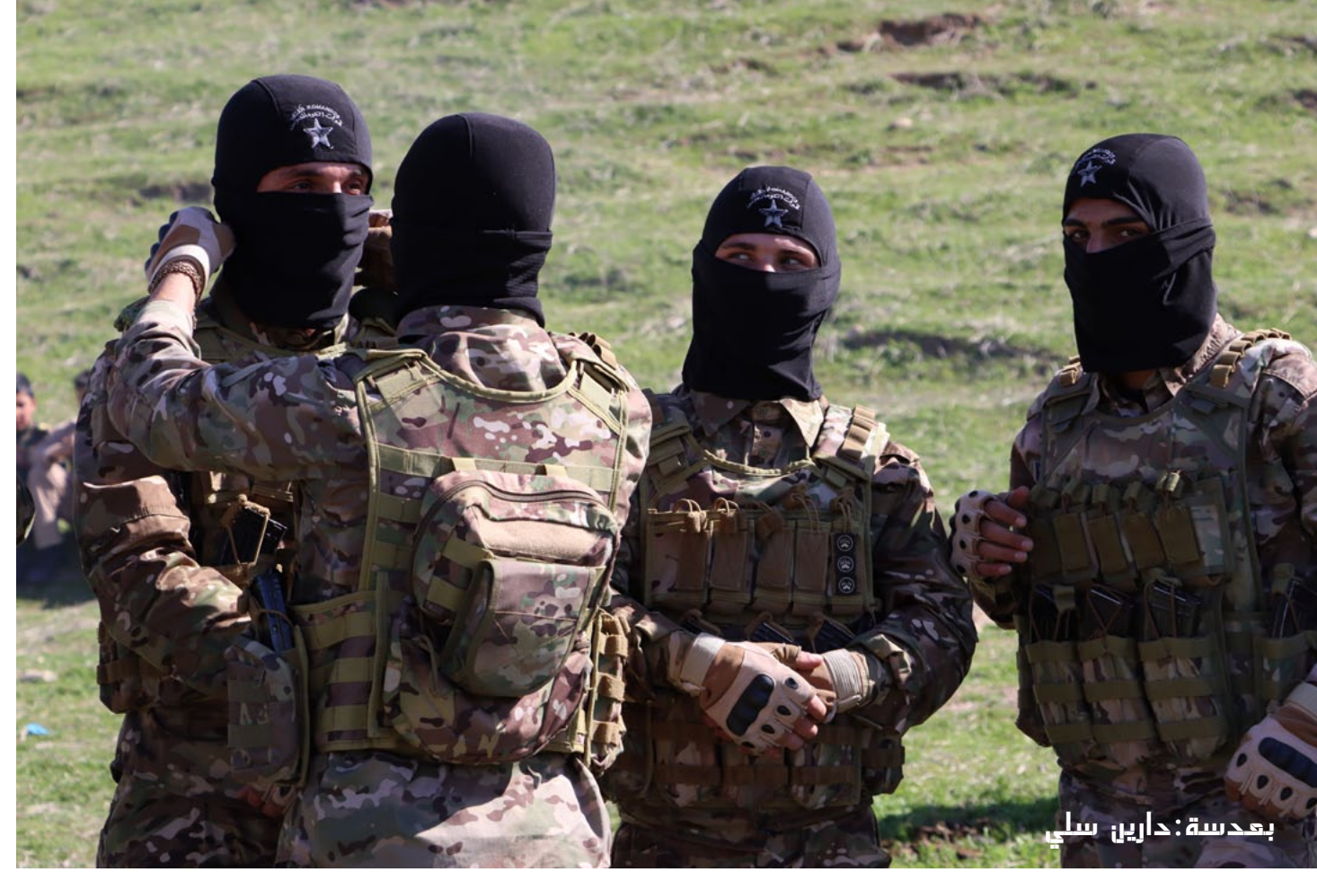
بحدسة: حاربين سلباً

سياسية ثقافية عامة - تصدر عن مؤسسة روناهي للإعلام والنشر ٥٠ ل.س العدد ١١٠٩ - الإثنين ٢٦/٤/٢٠٢٠م