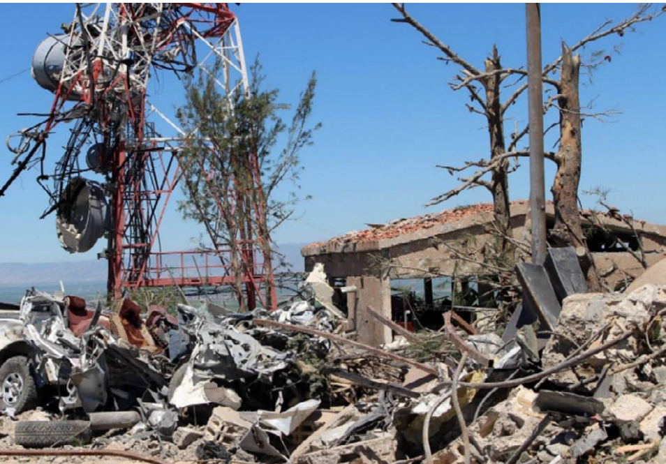
خلال هذا الهجوم، ومن خلالها نستذكر كافة شهداء الحرية والديمقراطية والإنسانية.

وروسيا على معلومات حول العملية قبل ساعتين من تنفيذها، وذلك بموجب اتفاق بيننا».