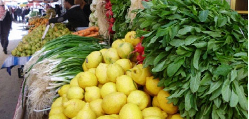
سوق الفواكه والخضار في مدينة قامشلو

الفكاكية والخضار، تحترق سلعاً أساسية مع حلول شهر رمضان المبارك، إلا أن سوقها البدرخانية».