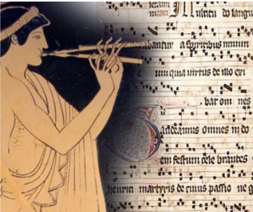
تسميتها السريانية الأصلية ونطقها: