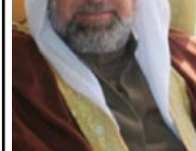
الدين معاملة -۱.