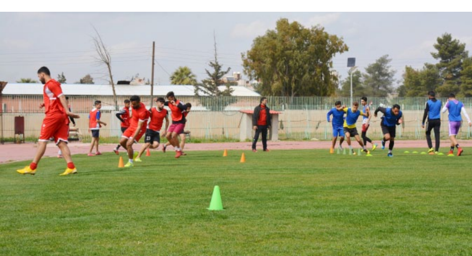
منتخب إقليم الجزيرة

وقاموا بتبريد شعارات تجسد الطاغية صدام حسين رئيس النظام العراقي السالط وسب رموز الشعب الكردي، وبعدها تدخل النظام البعثي التي قمع تجهمر أبناء قامشلو لمعرفة مصير أبنائهم بعد سماعهم