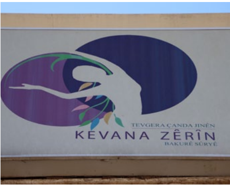
الذي شهدتها المرأة في الفترة السابقة، وقالت: