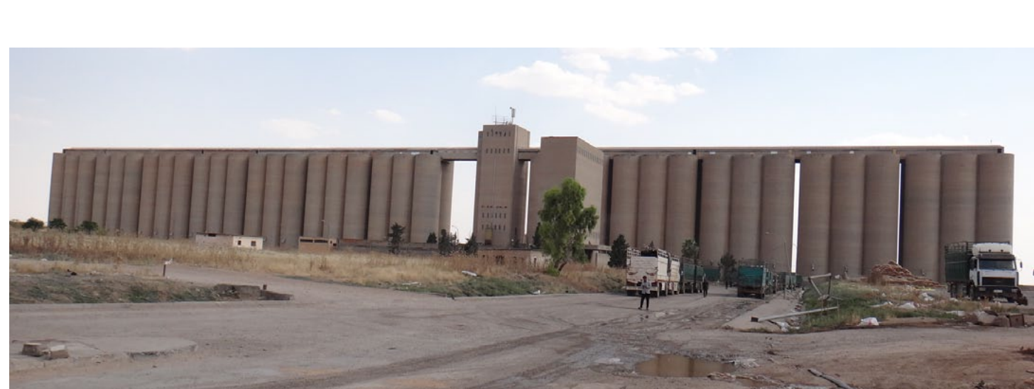
محجرة الصخرة – بيرفان حمي

قرية اليوسفية التي أصبحت أحيائها مكباً للقمامة، وخاصة على أحواض التصريف، ويعتبر منظر غير حضاري وتنتشر في القرية روائح كريهة، مشكلة إن لم يتم تداركها قد تتسبب بانتشار الأمراض والأوبئة فيها، وبلدية عرعر وعدت بحل المشكلة قريباً.