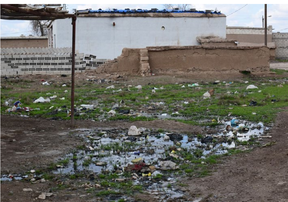
قرية اليوسفية التي أصبحت مكباً للقمامة، وخاصة على أحواض التصريف، ويعتبر منظر غير حضاري وتنتشر في القرية روائح كريهة، مشكلة إن لم يتم تداركها قد تتسبب بانتشار الأمراض والأوبئة فيها، وبلدية عرعر وعدت بحل المشكلة قريباً.