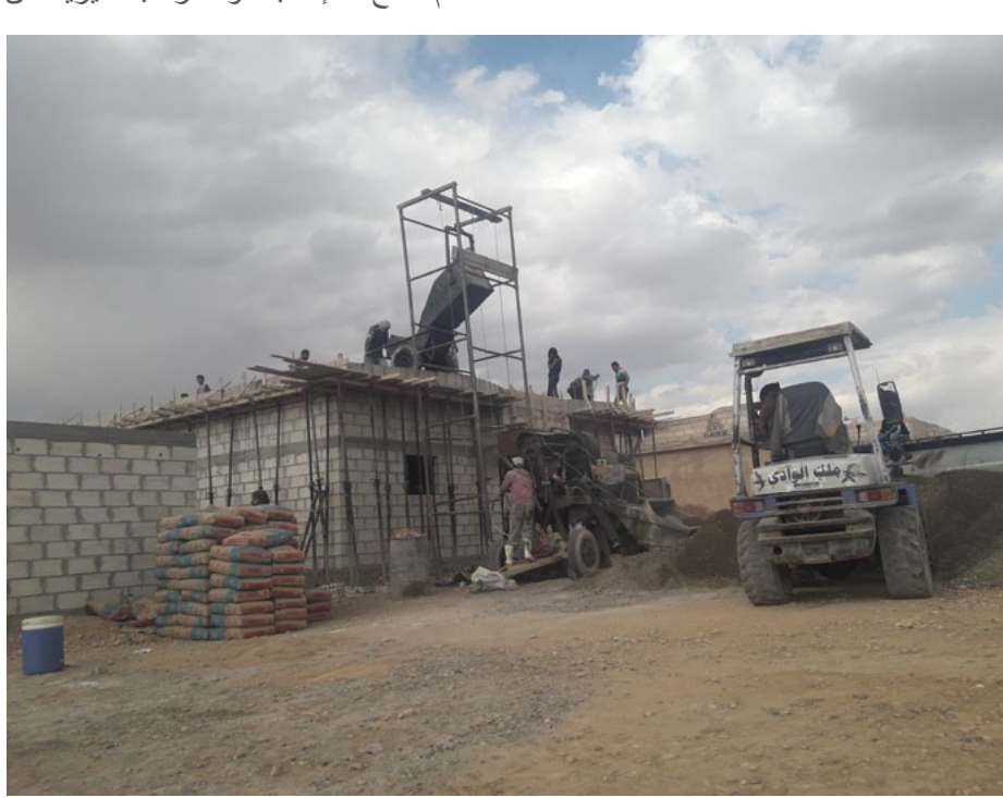
عمال البناء في حلب

ونوه العبد الله إلى أنه يعمل مع ورشة لصب الباطون بدون أجر محدد وذلك حسب مساحة سطح المنزل الذي يتم بناؤه. مشيراً إلى أن أجرته تتراوح ما بين الـ /٢٥٠٠٠ والـ /٥٠٠٠٠ ليرة سورية فقط، وهذا المبلغ لا يمكن الشخص من شراء لتر واحد من الزيت.