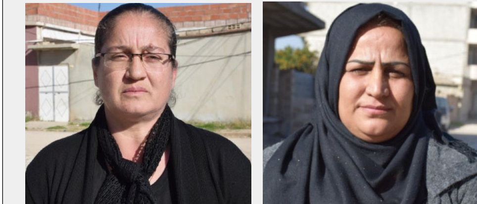
هيفي سيد / نجاح سعيد

كردية، فقد أفضل المقاتلون الأساس الأطماع الاستعمارية التي كان يخطط لها الاحتلال التركي وأصغره، وكل هذا النصر بسبب الفكر ولسفة القائد عبد الله أوجلان وتضحيات شهدائنا، وإرادة مقاتلي ومقاتلات قوات الدفاع الشعبي».