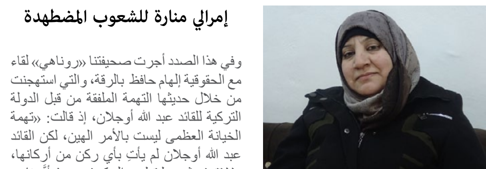
إمرالي منارة للشعوب المضطهدة